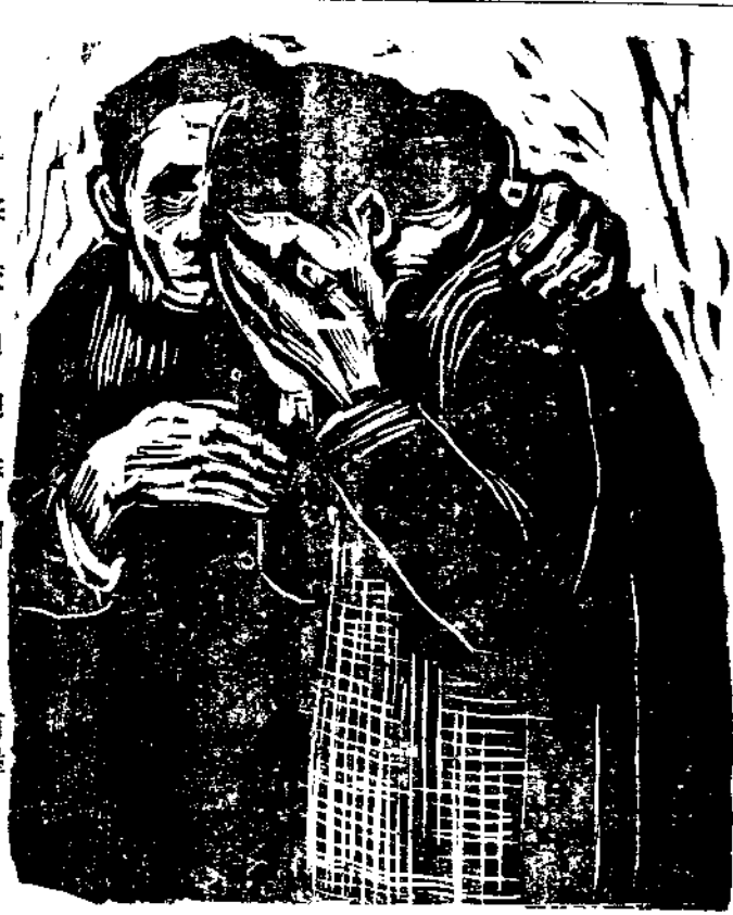
飢寒交迫迎勝利。甫堡。

這裏所謂東北，牠的範圍在從前是指遼寧，吉林，黑龍江，和熱河等四個省區，現在則當然指最近新劃的九省——遼寧，安東，遼北，吉林，松江，合江，黑龍江，嫩江，興安，及哈爾濱，大連二市而言。東北自從「九一八」事變淪陷以後，以迄最近抗戰勝利為止，足足有十四個年頭，在這十四年的漫長歲月中，東北三千萬民衆無時不在水深火熱裏面過活，其所遭遇之種種痛苦，實非筆墨所能盡述，思想行動，毫無自由可言。現在抗戰勝利，東北國土，重現天日，被奴役了十四個年頭的東北民衆，已隨着抗戰勝利之光臨而獲解放。今後將重慶其非依法律不得限制之自由生活，是可斷言。最近中央已明令公佈將遼，吉，黑三省，重新劃分爲九個省行政區，這種重行劃分行政區域，在中央自有重大意義，即就人民行使四權一點來說，亦殊有其必要。蓋省區範圍縮小，組織易於嚴密，對人民行使四權之訓練和扶植，自較而稍遼闊，組織懈弛，甚或政府有觀長莫及之感者，容易收效。至於是否一則其對於此一地帶之重視，可以想見。在陸路方面：膠濟是自長春鐵路直出的駛入蘇聯國境重要門戶，遼東和蘇聯的海蘭泡，隔江相對，地勢尤爲險要。水路方面：遼東半島伸入黃，渤二海之間，沿岸良港甚多，連山灣，旅順口和大連灣等處，尤負盛名，均爲海防上之重要據點。今後太平洋上之能否久遠安瀾，要視吾國在東北方面國防上之設施如何而定。吾國爲世界最大強國之一，對維持世界和平，扶助弱小民族，使其獲得獨立自由，自負有獨當一面之責任，而達成此一責任之具體措施，除於政治經濟乃在外交各方面努力以外，而尤應致力於國防之建設，而就現階之國防形勢來說，東北方面，更應爲建設國防之中心區，以建設國家之力量，建設東北。關於此點，中央已有詔示，今後問題，只是吾全國上下，應如何身體力行而已，於此可見東北將爲保障國家，安定世界和平之基地了。