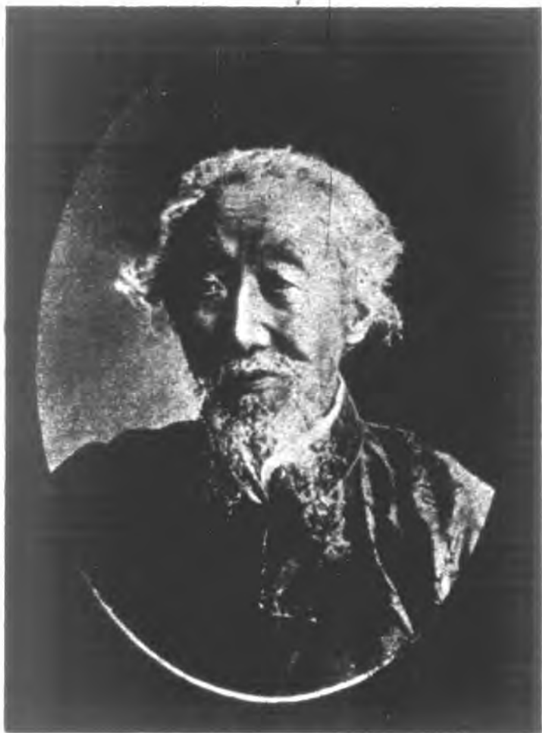
張充仁土山濤製版部舊生繪