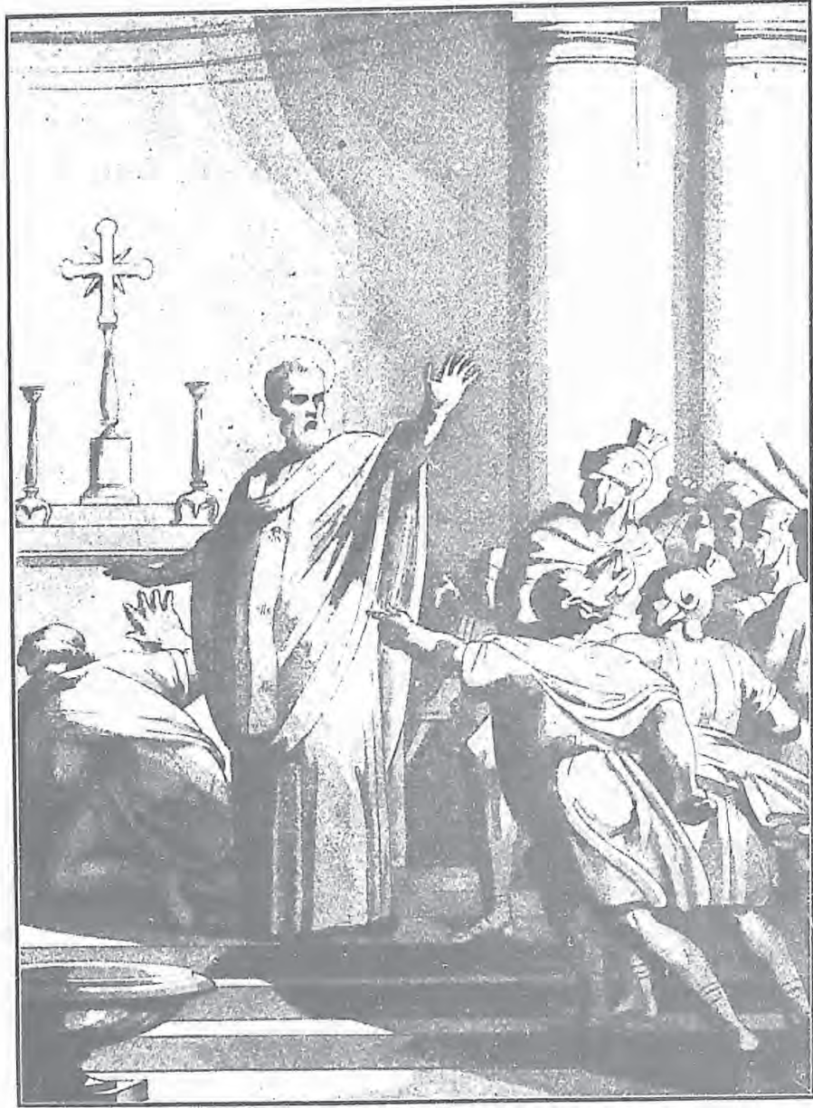
聖基所主教在堂裏不使兵卒逮捕官吏