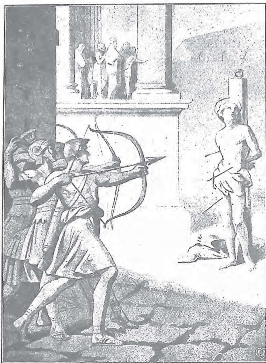
聖巴斯底盎被縛於柱受亂箭射死