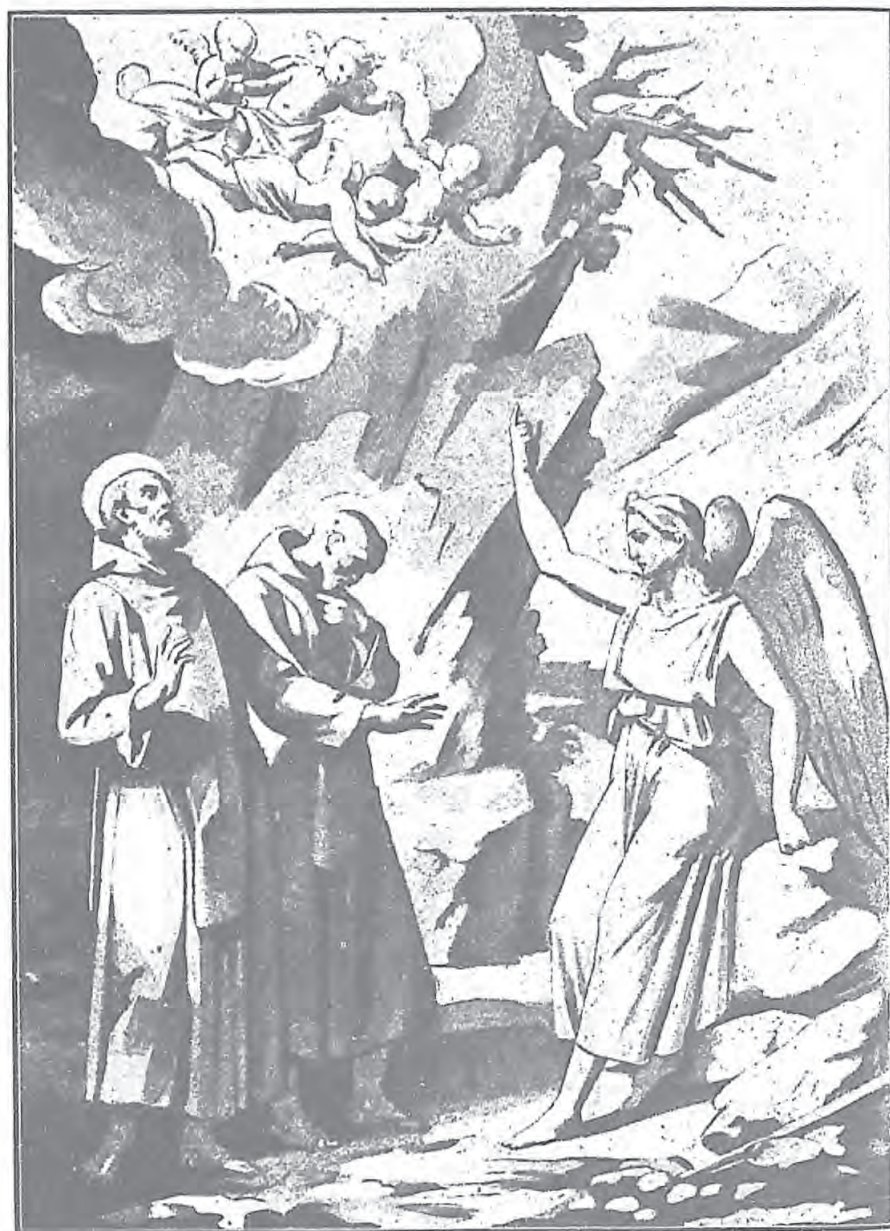
聖賽維林在曠野中受天神的教導