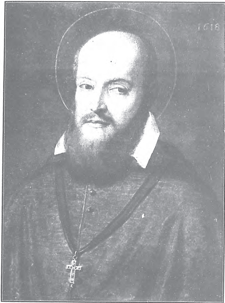
聖方濟各撒肋爵主教肖像