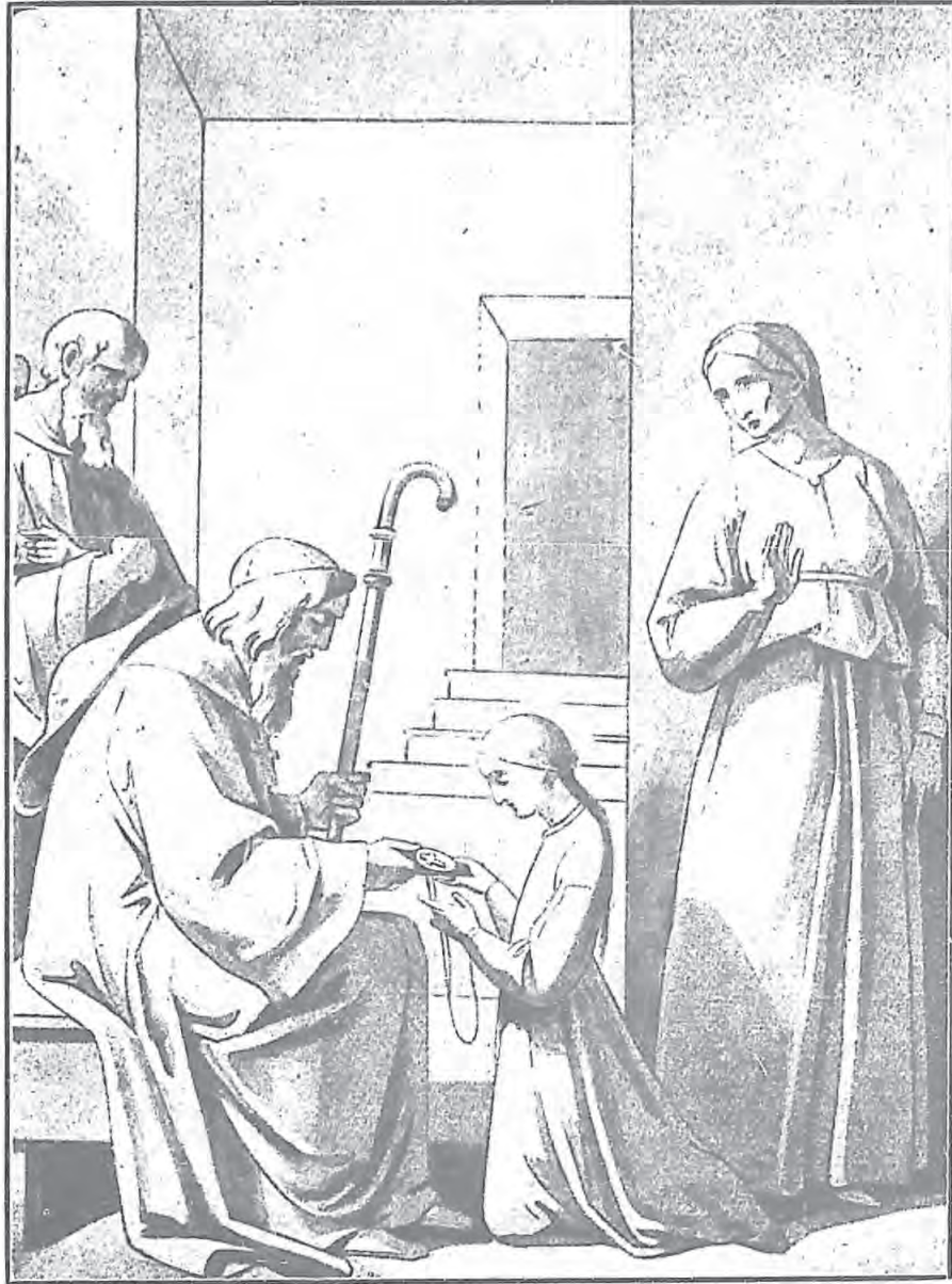
一 領 取 中 手 教 主 奴 馬 日 聖 從 法 維 諾 格 女 聖 一 飾 品 裝 飾 的 唯 一 她 做 常 牌 聖