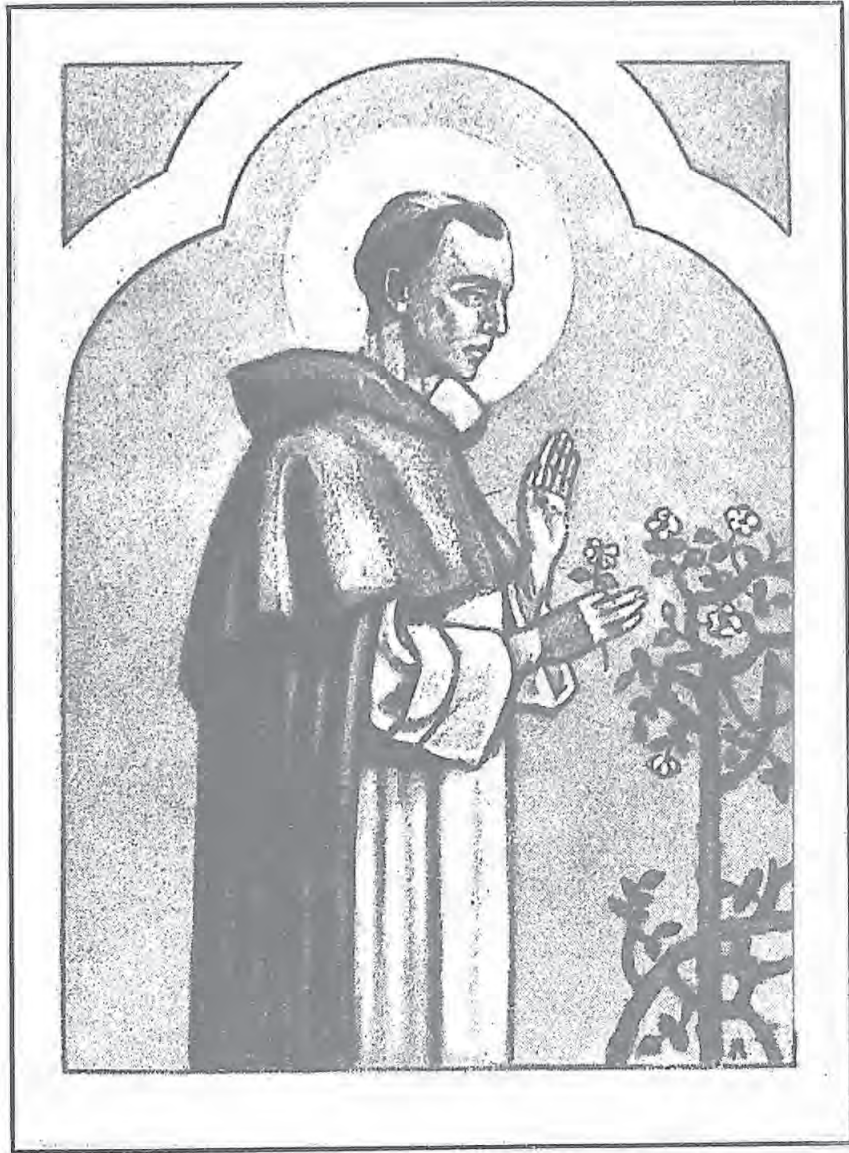
眞 福 蘇 叟 肖 像