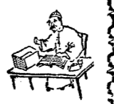
論語子路有聞章 長 郭兆辛