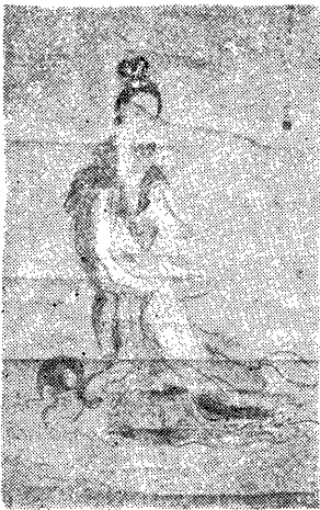
莫 愁 畫 像

後經「江南女兒」之抗議，乃加刪改，故今勝棋樓之聯，無顏色已改「生顏色」，「青山依舊」改爲「青山無恙」，其後跋語云：「同治十年，重新莫愁湖亭，桂蕙亭司使邀遊索題。余按樂府詞，莫愁以河中人嫁盧氏，盧亦北方名族也，石城艇子，說者岐異，蓋麗質嘉名，流傳詞賦，如宋子齊姜之氏