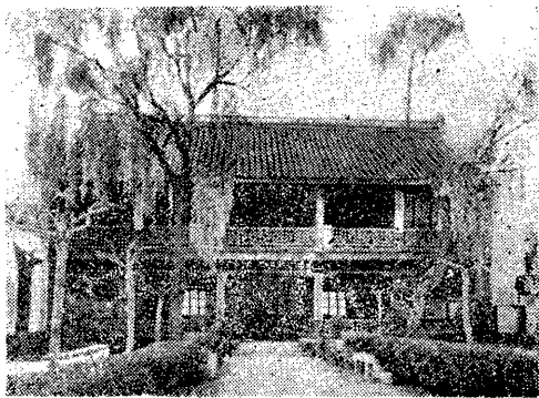
樓 棋 勝

賜以樓曰「勝棋」。爲徐氏後裔之世業。樓下左側有一畫，係中山王十九世孫所製，畫徐達俯伏堦上，身縮一團，頭已不見，僅現冠頂纓絡。題解云：「一日，太祖與公之邸。豪飲之，罪（醉之誤歟？）蒙之臥舁以正寢，醒而驚。趨下堦俯伏稱罪。帝覘之大悅。乃命有司卽舊邸前治甲第，表其坊曰大功坊。」（在今中華路三山街附近，仍稱大功坊）讀此，吾人了然於明太祖，一代專制皇帝，駕馭羣