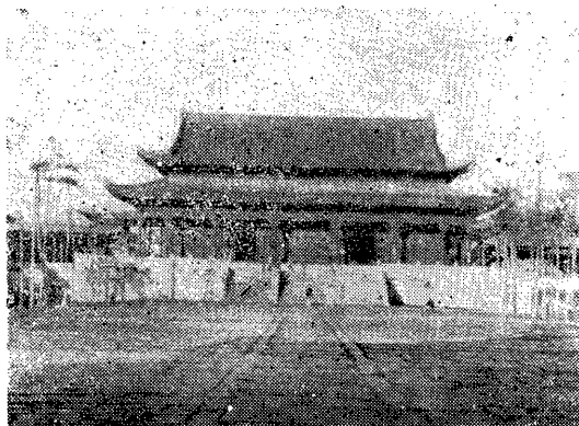
殿 成 大 宮 天 朝