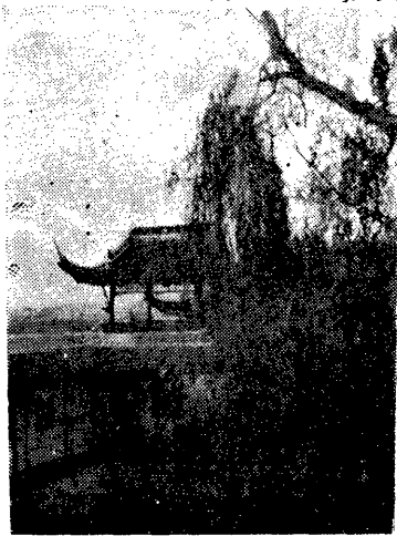
會 公 閣

六、粵軍烈士紀念碑：出華嚴庵向西，越廣場，有三石碑并列，中係國父手書「建國成仁」四字，民元所建，