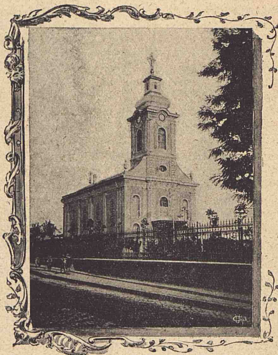
Biserica Madona-Dudu din Craiova.

În 1801, în focul cel mare, biserica fu cuprinsă și ea de flăcări. Cu o adâncă durere scrie un contemporan, dintre hoieri, despre halul în care ajunsese clădirea: „Dela ușa bisericii până la sfântul altar au fost trei focuri, adecă în sfânta biserică în-lăuntru, și pe foc ce au fost jețurile toate, jățul episcopului, foșorul unde ședea femeile, amvonul diaconului de sus, din sfintele icoane,—care de două sfinte icoane mi-au ars inima; stâlpii cei mai poleiți de lângă sfintele icoane, sfânta respetic,