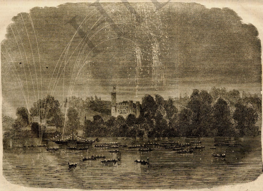
Иллюминация на Штербергском озеръ въ честь русской Императрицы.

собранных по подписке. Вообще, благодаря неловкому усердию министров, дело Бодена может иметь большое влияние на будущность империи, потому что с него началась согласная борьба