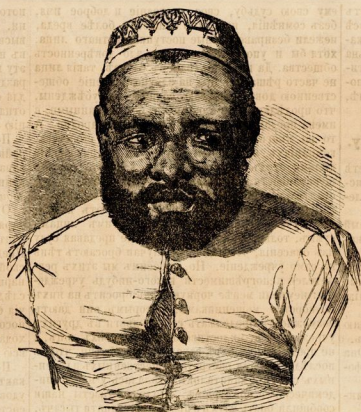
Султанъ острова Маютъ.

— Приѣхавъ во Францію Фатунъ, королемъ острова Моголи, напоминалъ, что французское покрови-