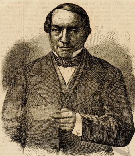
Дюк Ротшильд. (См. Неврологъ встаетъ.)

ведет полицейские чиновники. Городские ворота заняты войсками. На чашечковой площади находится 4 отряда войск. В первую «на словах» и в Тинской церкви, где похоронены славянские апостолы Кирилл и Мефодий, присланы целые полки. При дверях каждой церкви находится отделение тайной полиции, отделение государственной полиции и отделение жандармов. Каждый, носивший черное платье, арестовывается. Бляза-гора занята батареями. В церкви св. Якуба, послы модерна, арестовано много мужчин и даже в траурных платьях. Полиция предполагала, что эти арестованные носят народный траур, вследствие сражения на Блязо-горы. При церкви св. Якуба арестовано 13 человек, при церкви на Славанехъ 17 человек и, кроме того, несколько дам. Вечером войска вернулись в казармы, порядок нигде не был нарушен. Уже три дня назад, войска заняли окрестности Праги и особенно Блязо-гору, Пражский гарнизон, по рапортам полиции, был убежден, что будет случиться и придется побороть Венделу и Берндлеву систему на Блязо-горы, как французам свои Шасно при Ментай. Войска очень огорчены ложными слухами полиции, вследствие которых они были три дня на ногах и частью под проливным дождем. Генерал жалуются на государственную полицию, которая уже несколько раз ложными слухами тревожила гарнизон, без всякого основания, при глубочайшем слепотстве обывателей. Несколько студентов и молодых дивчат, арестованных