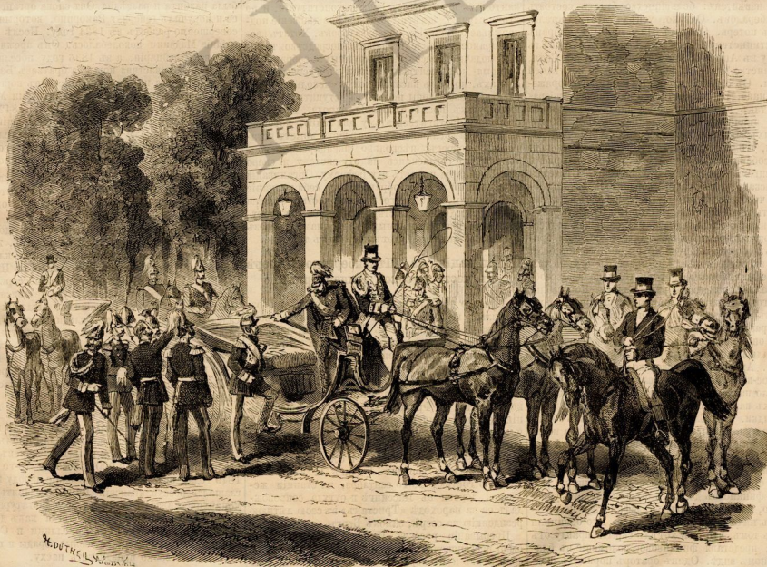
Прібытіе Государя Императора въ Потсдамъ.

Испанія. — Партіи начинаютъ волноваться въ Испаніи. Изъ республиканскихъ начальниковъ многие пристрали къ прогрессистамъ, согласившимся на конституціонную монархію. Но демонстраціи являются серьезными революціею. Правительство бѣжитъ въ Барселонѣ студенты протестовали противъ мѣры, опредѣлившей давать пять дѣлъ для того, чтобъ имѣть право голоса, то-