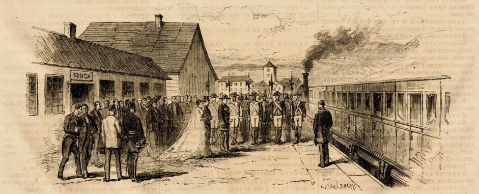
Отъѣздъ испанской королевы изъ Сан-Себастьяна.

Долго этотъ замокъ стоялъ пустымъ. Въ немъ помѣстили на время пѣвнаго Абделя-Кадера, ко-