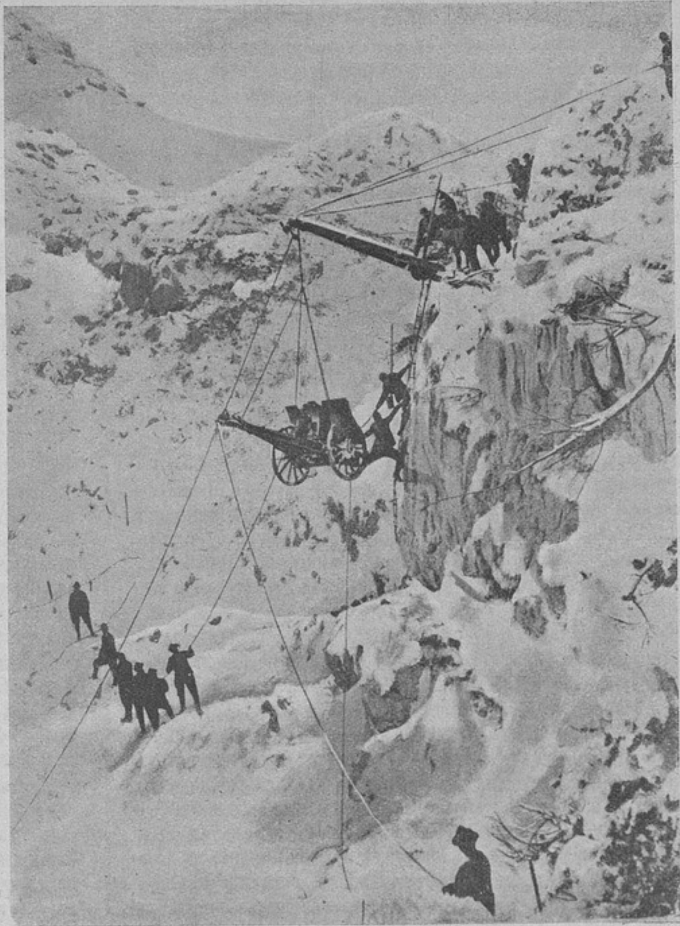
Подъемъ итальянцами орудій на гору.

Вообще намъ кажется, что гг. воспитатели поступили бы правильнѣе, если бы всемѣрно старались убѣдить кадетъ въ томъ, что только люди съ болѣе или менѣе законченнымъ образованіемъ могутъ принести всю ту пользу, которую отъ нихъ въ правѣ ожидать родина, несущая громадные расходы на ихъ подготовку, а не подливала бы масла въ огонь своими статьями, способными возбудить у кадетъ еще большую нервность.