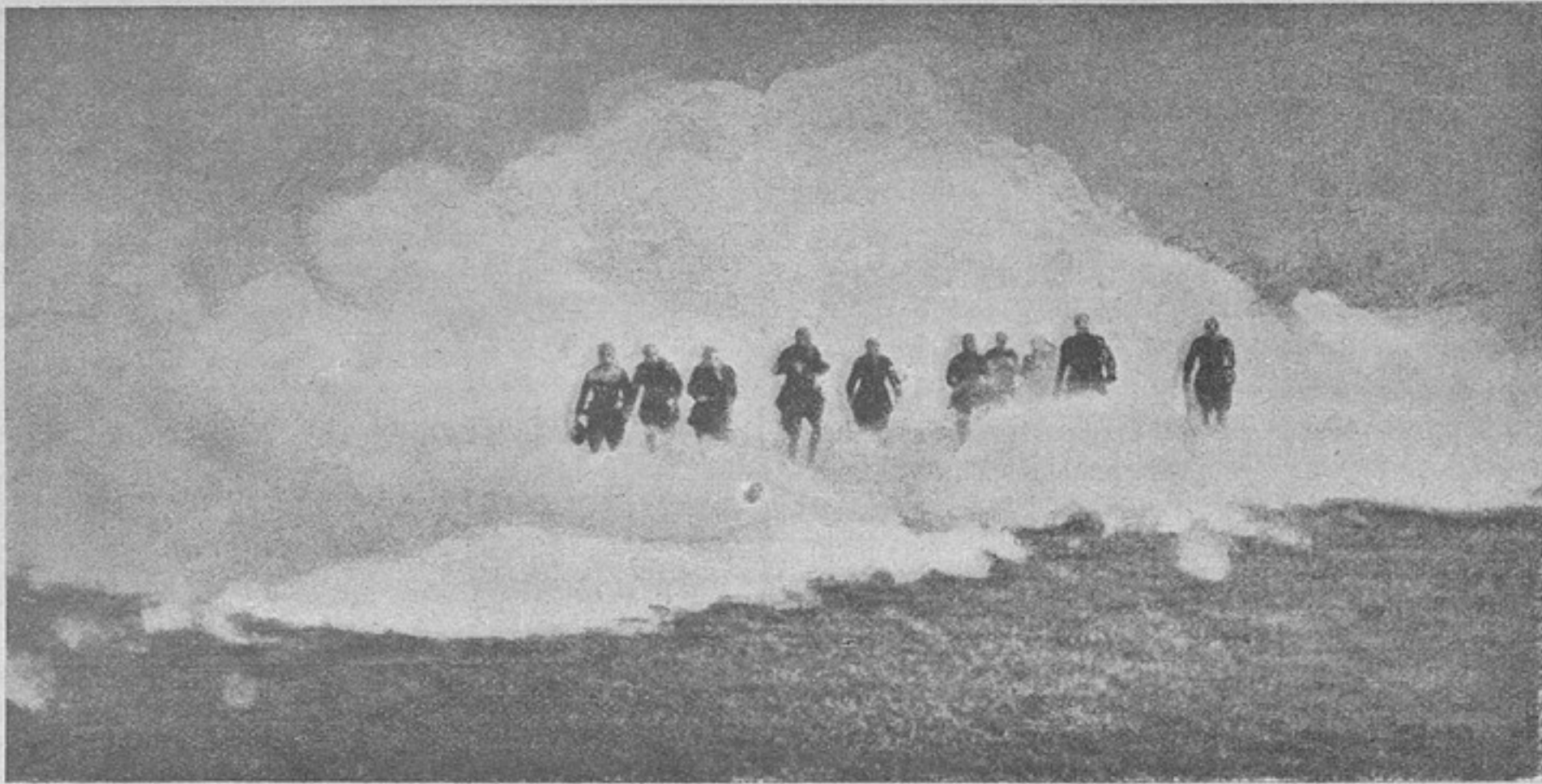
Нѣмецкая газовая атака.

Стр. 231 примѣч. 39. — Фраза, начиная со словъ «Команда надъ Немировской милиціей» и кончая точкой, неудачна по своей редакціи.