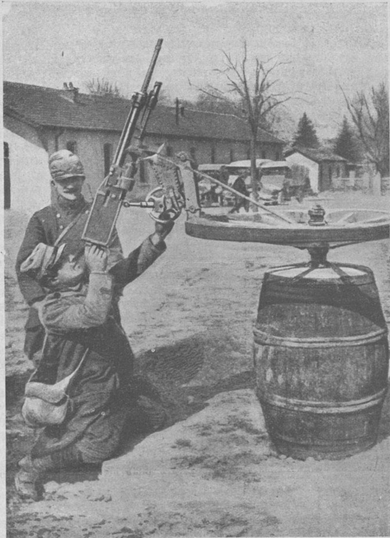
Самодѣльная установка для обстрѣливанія аэроплановъ. („The Graphic“.)

того Бестужевымъ были изобрѣтены, какъ извѣстно, капли, помогавшія по тѣмъ временамъ отъ всѣхъ болѣзней, между прочимъ и отъ желудочной.