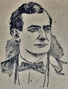
COL. W. J. BRYAN.