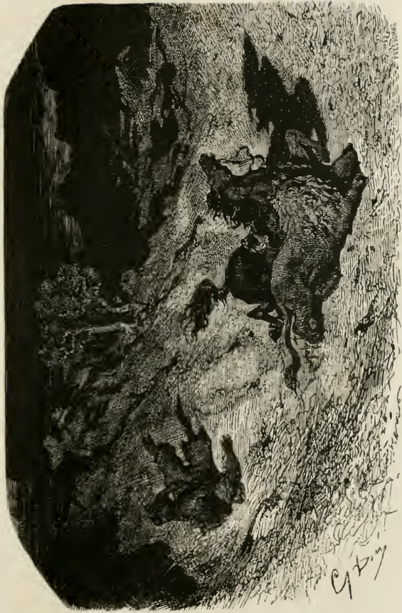
Un lion avait étranglé un cheval au fond d'un ravin