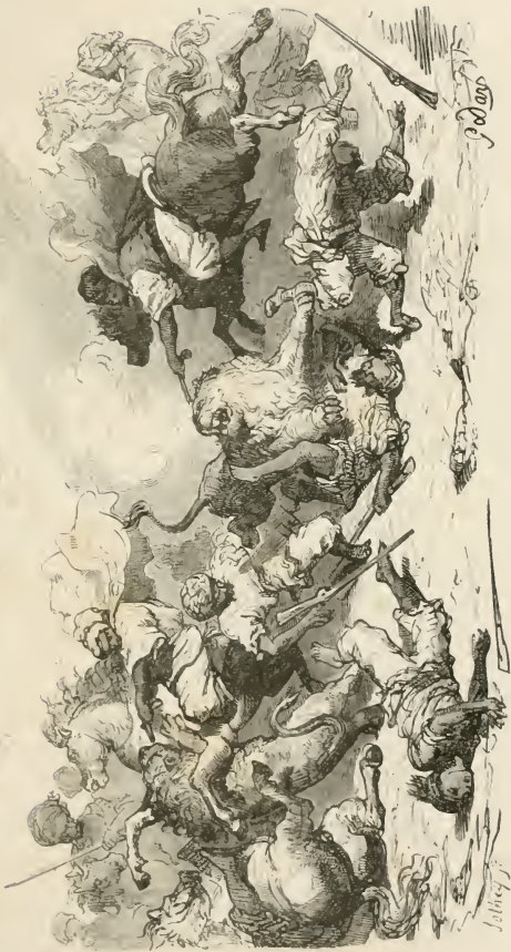
Le lion, se voyant découvert, est tombé sur la troupe.