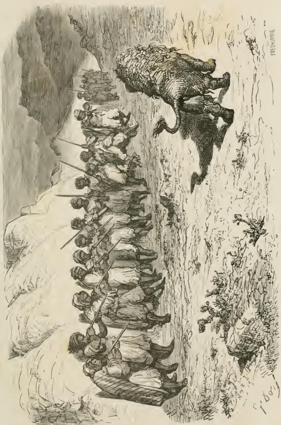
Le lion passe majestueusement devant eux.