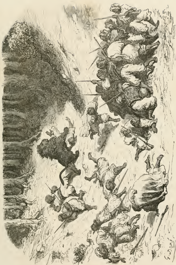
Il fond, la tête haute et la queue ensanglantée, sur la ligne des chasseurs.