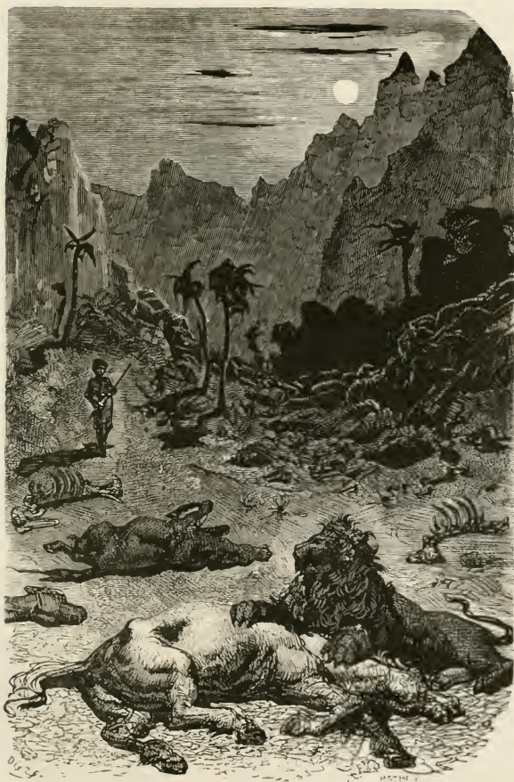
Il mange lentement et vous fera l'honneur de vous regarder de temps en temps