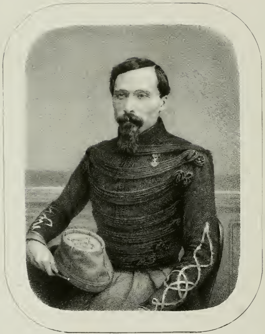
LE GÉNÉRAL DE L'ÉCOLE DE LOUIS