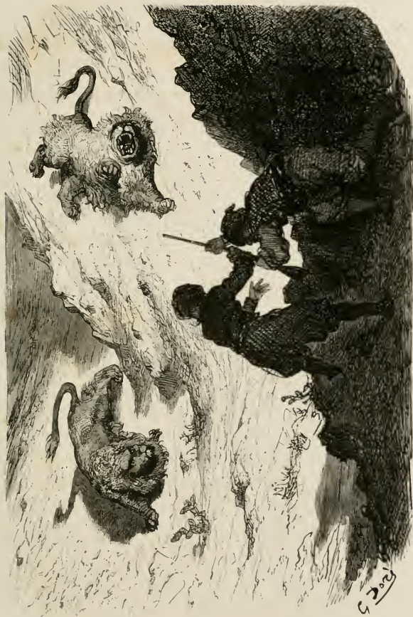
Tout cela s'opéra sous la protection de saint Hubert, mon patron