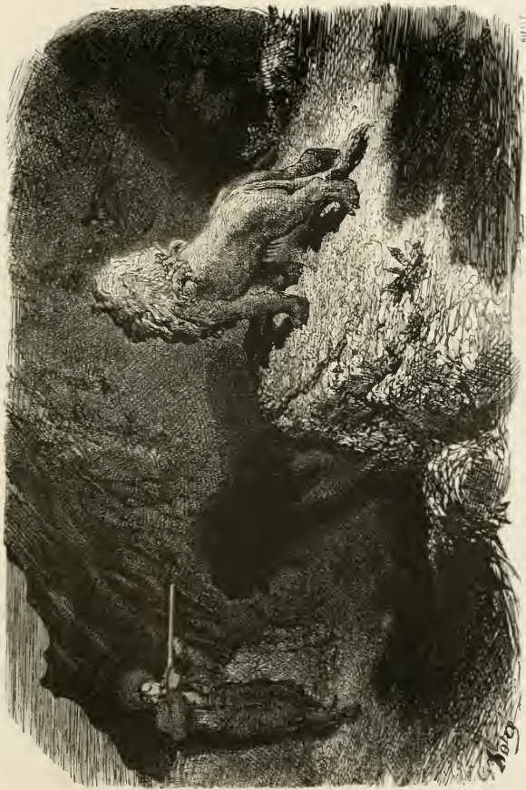
De deux choses l'une : ou le lion est tué instantanément, ou