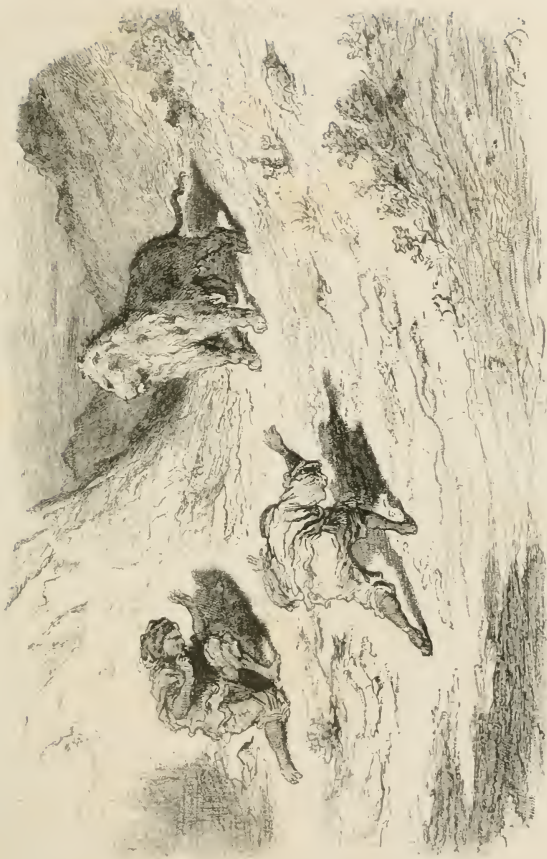
Ils essayèrent des prières.