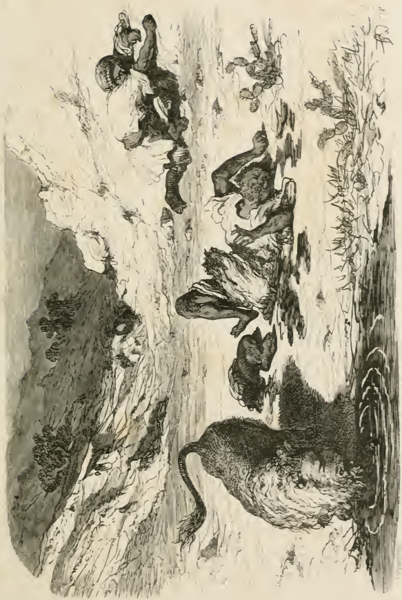
Le pauvre diable qui restait chercha autour de lui un refuge