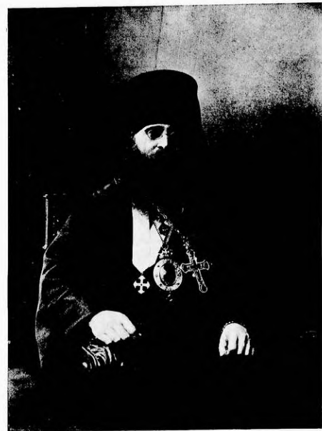
Преподобный Стефанъ Епископъ Могилевскій и Мстиславскій.