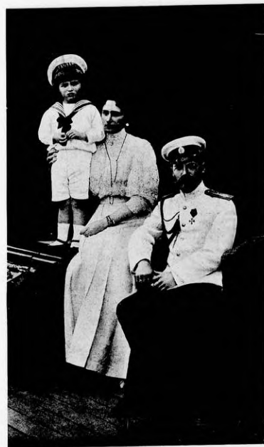
Ихъ Императорскія Величества Государь Императоръ НИКОЛАЙ АЛЕКСАНДРОВИЧЪ, Государыня Императрица АЛЕКСАНДРА ФЕОДОРОВНА и Его Императорское Высочество Наслѣдникъ Цесаревичъ и Великий Князь АЛЕКСѢЙ НИКОЛАЕВИЧЪ