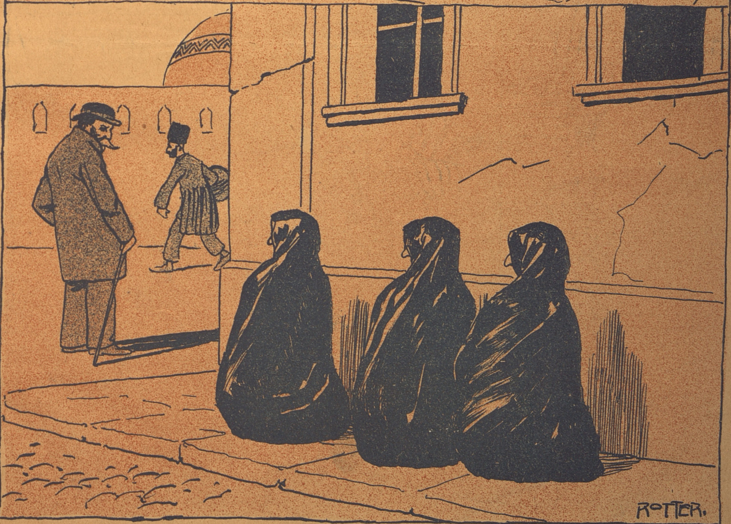
آه بیهوشن آوازه یلار ...