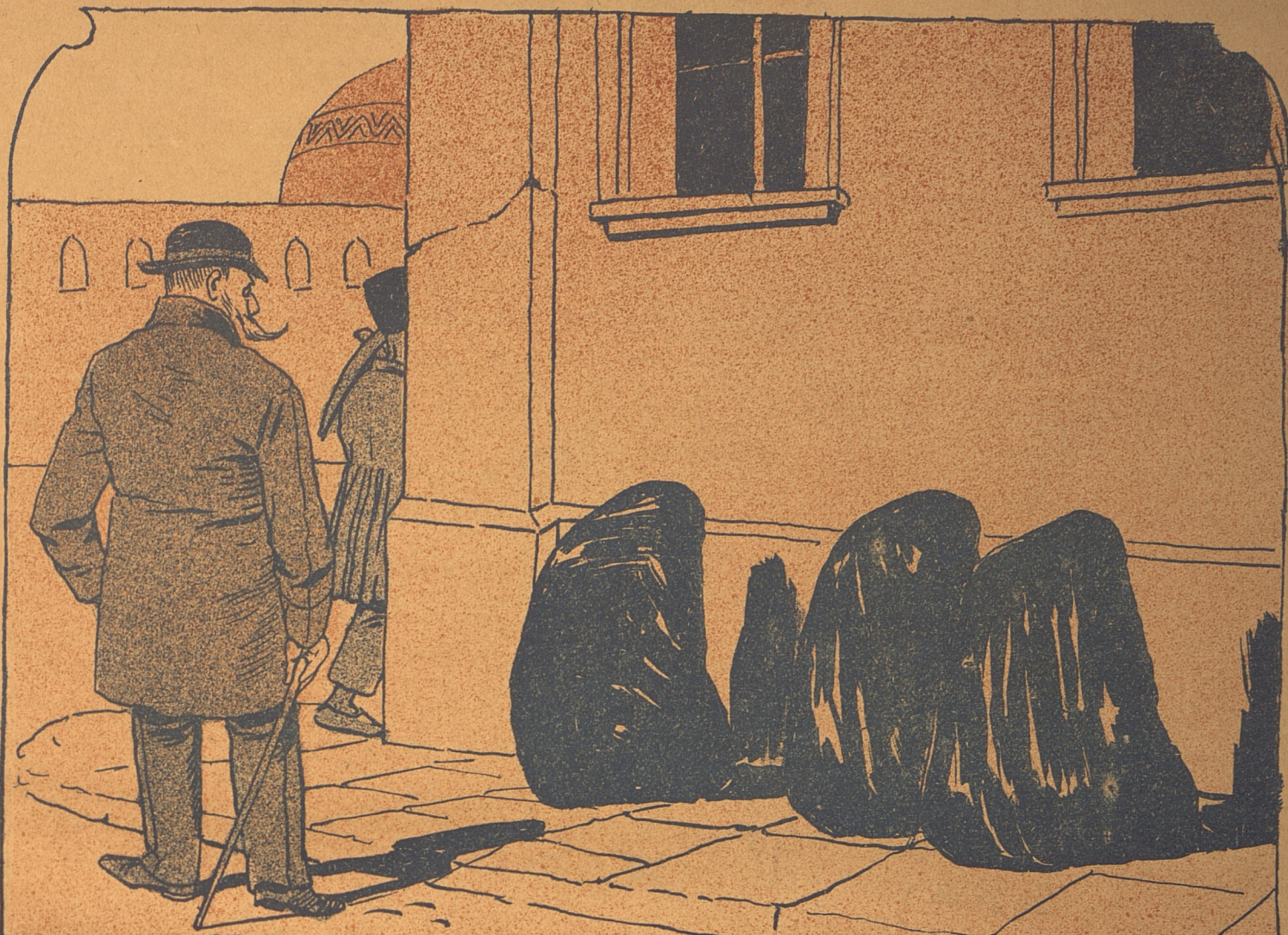
نه در بنگار ...!