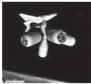
Перших постояльців готель прийме вже через 3 роки.