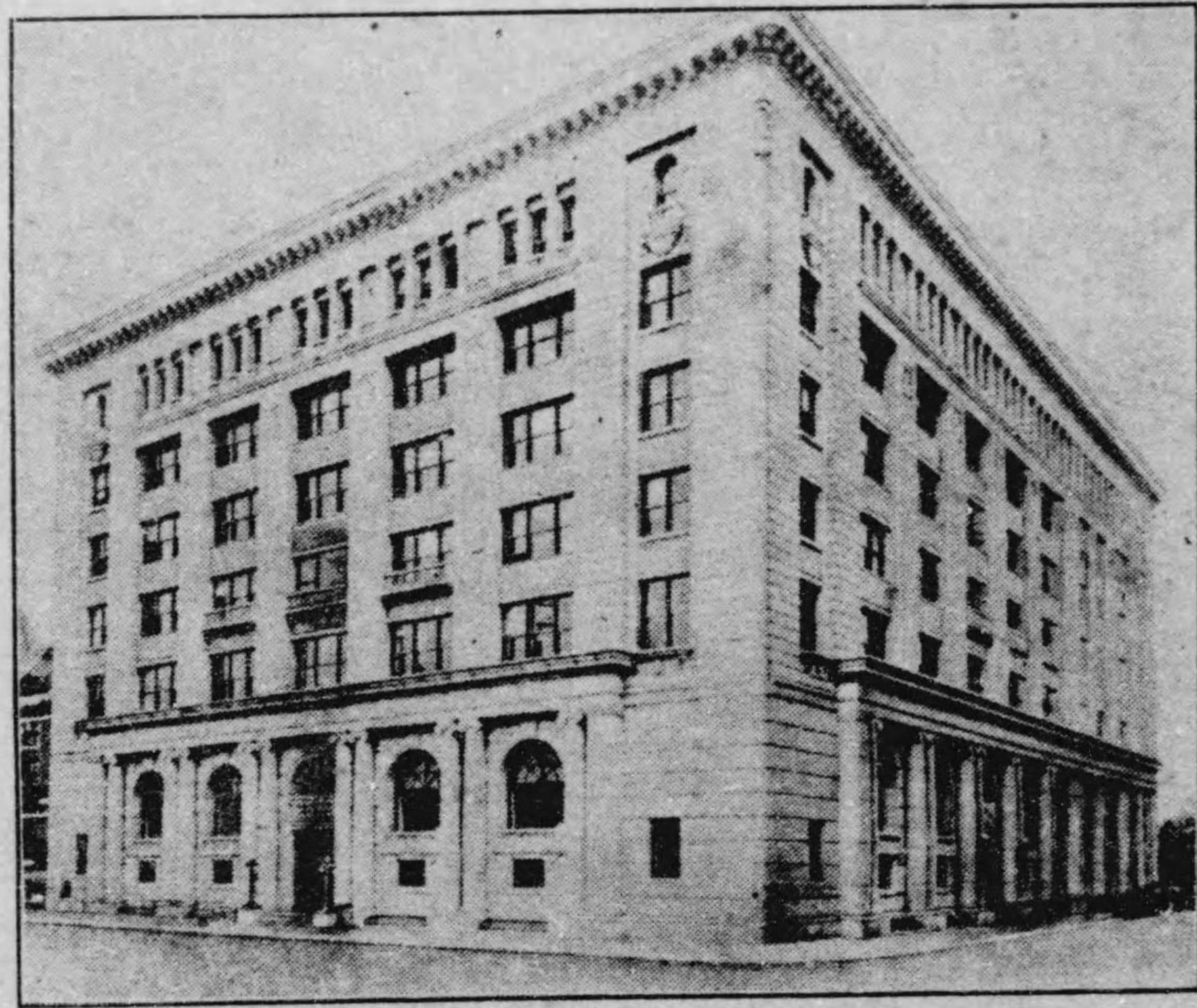
日本興業銀行本店