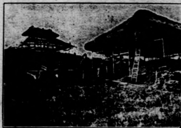
(二) 圖築建 村樂僑

大禮堂一幢、辦公室一幢、倉庫一幢、合作社十幢、住室一幢、廚房二間，（附僑樂村建築及中部村舍影片各一）