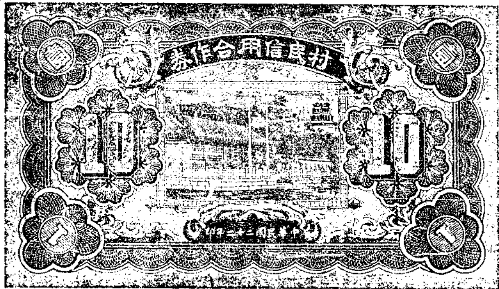
(面背) 券作合用信之行發村青石縣襄定西山

收回之利息，以年利九厘，責成本社辦事人員經營之，如同包辦性質，所有超過九厘所得之利息，作為本社辦事人員之紅利。縣銀號所得總合作社之利息，除半數作為建設