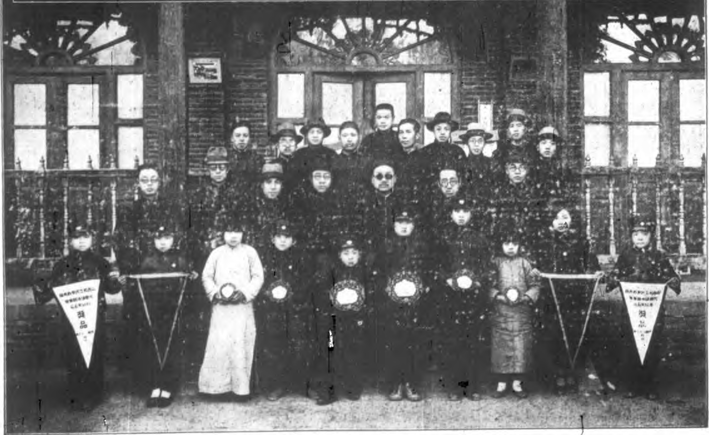
山西省立民眾教育館兒童演講競賽會職員評員暨得獎兒童合影 二十二年四月十日