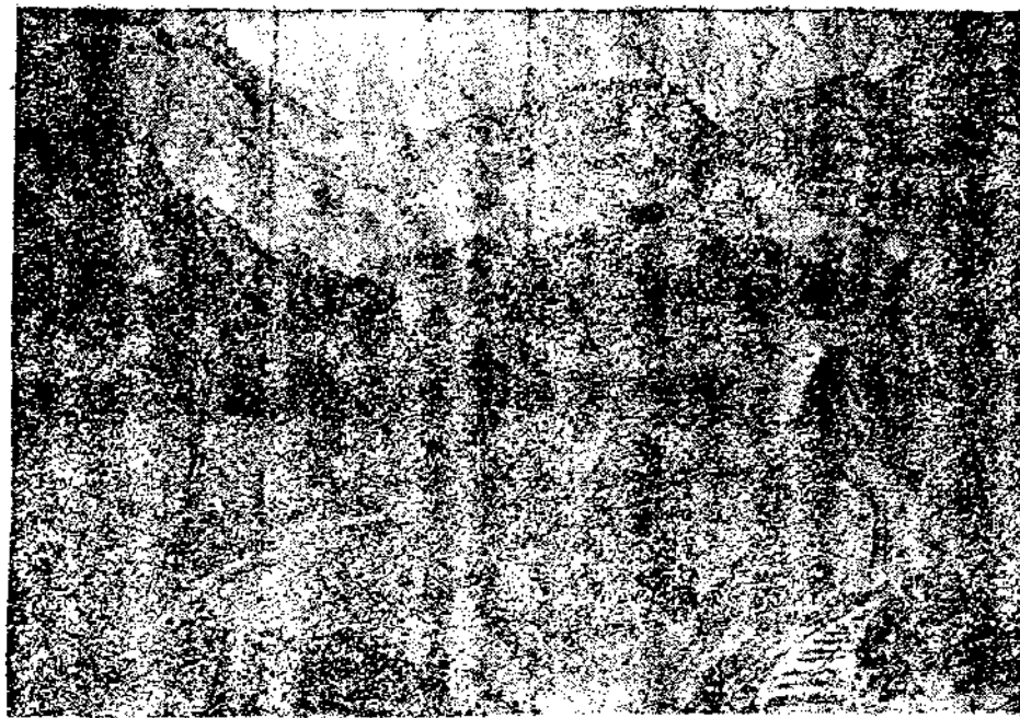
筑城四郊樹林層疊是前保馬東郊所見之一