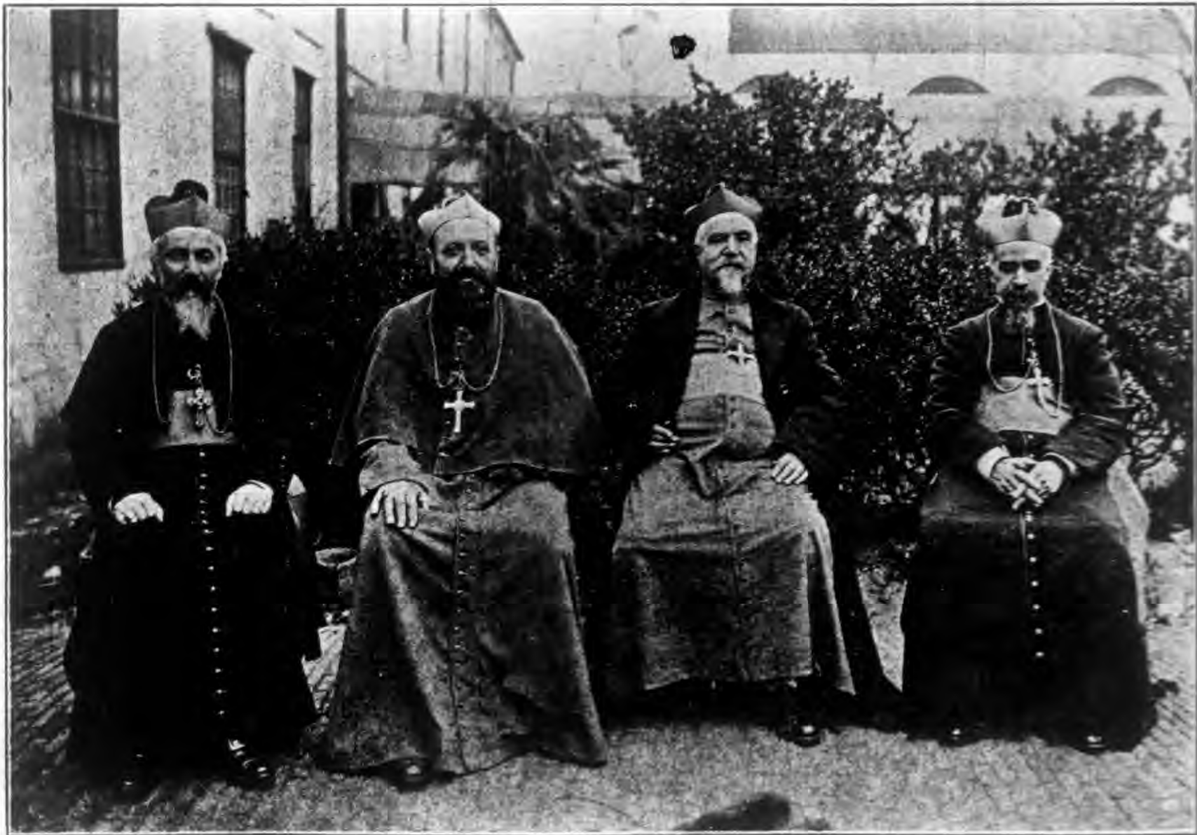
教主梅 教主劉 教主姚 教主杜