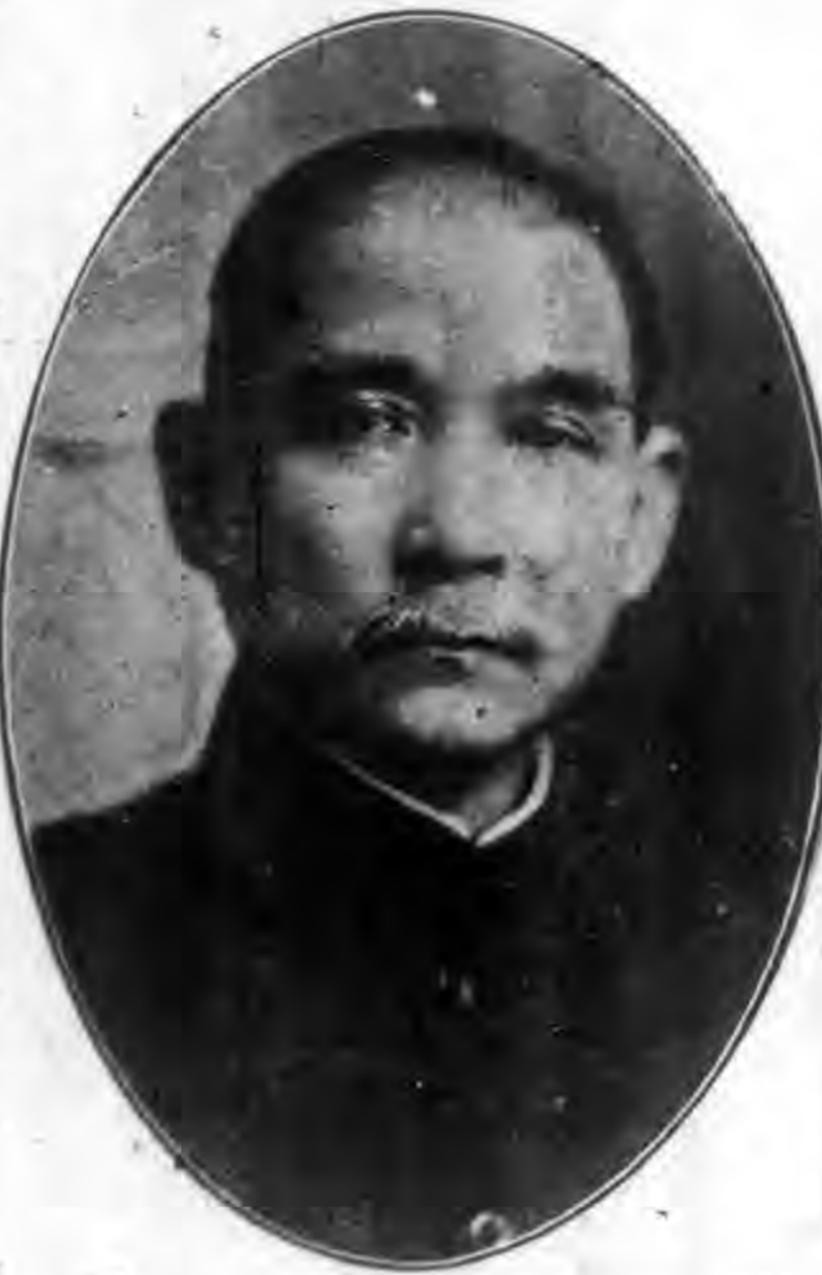
總 理 孫 逸 仙 Sun Yat-sen

本週刊以宜達總理主義政府法令暨發蒙古同胞知識促進一般文化為宗旨 本週刊以漢蒙兩體合璧文字印行之 本週刊內容按左列項目編輯之 (1) 黨義 (2) 法令 (3) 圖畫 (4) 論評 (5) 新聞 (6) 雜載 本社設漢文編輯一人蒙文編輯一人分任本週刊之編譯 本社設經理一人總理全社事宜 本週刊於必要時得贈刊一張或半張 余致力國民革命凡四十年其目的在求中國之自由平等積四十年之經驗深知欲達到此目的必須喚起民眾及聯合世界上以平等待我之民族共同奮鬥 現在革命尚未成功凡我同志務須依熱心所著建國方略建國大綱三民主義及第一次全國代表大會宣言繼續努力以求貫徹最近主張開國民會議及廢除不平等條約尤須於最短期間促其實現是所至為