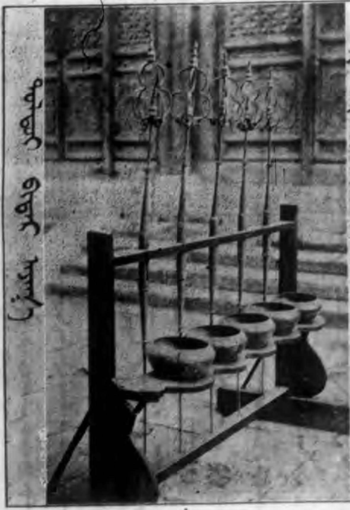
托勒托依已達爾益

第一條 本社每星期出版一張定名為蒙文週刊 第二條 本週刊以宜達總理主義政府法令暨發蒙古同胞知識促進一般文化為宗旨 第三條 本週刊以漢蒙兩體合璧文字印行之 第四條 本週刊內容按左列項目編輯之 (1) 黨義 (2) 法令 (3) 圖畫 (4) 論評 (5) 新聞 (6) 雜載 第五條 本週刊於必要時得贈刊一張或半張 第六條 本社設經理一人總理全社事宜 第七條 本社設漢文編輯一人蒙文編輯一人分任本週刊之編譯