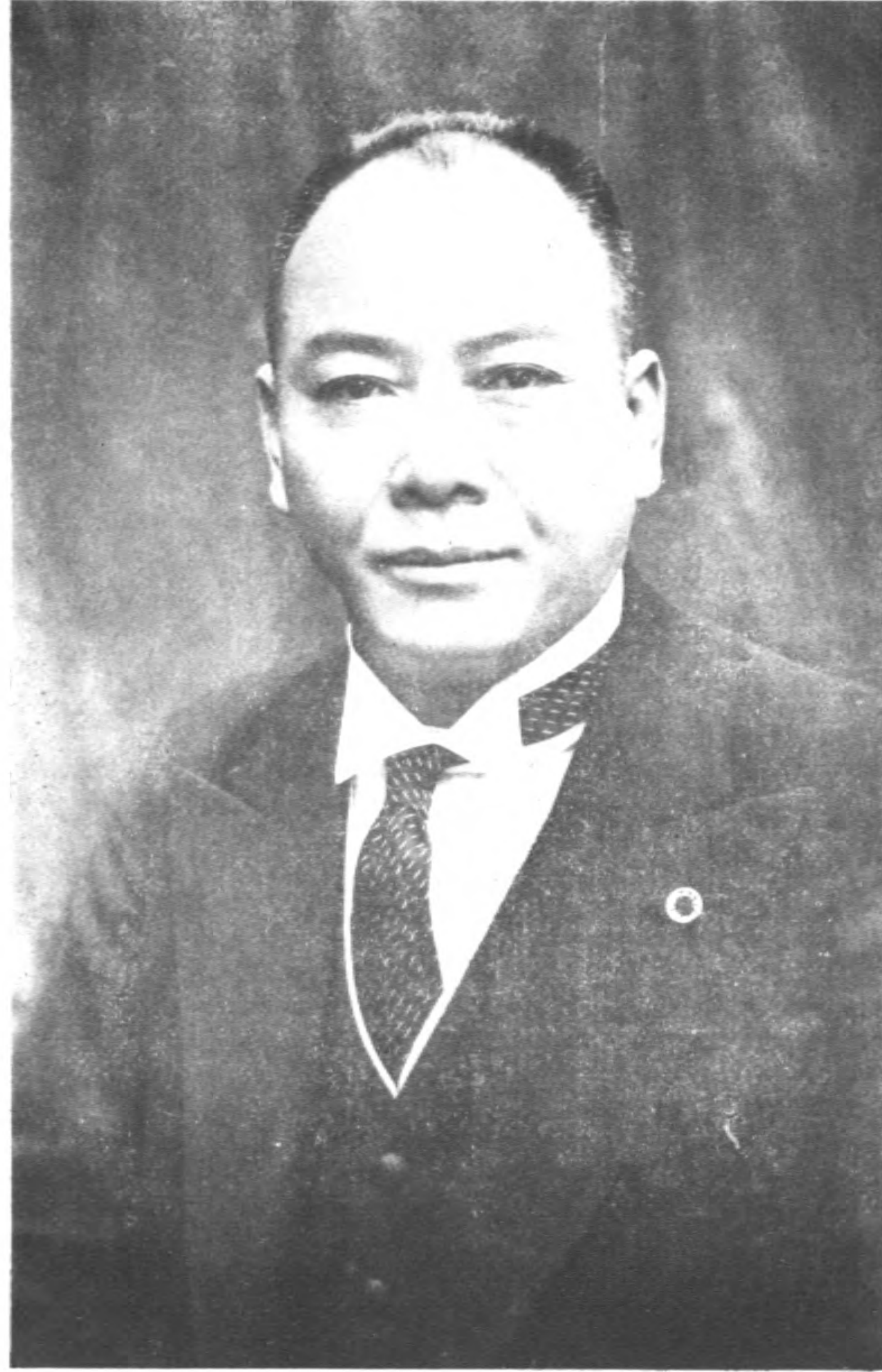
市 長 余 晉 齋