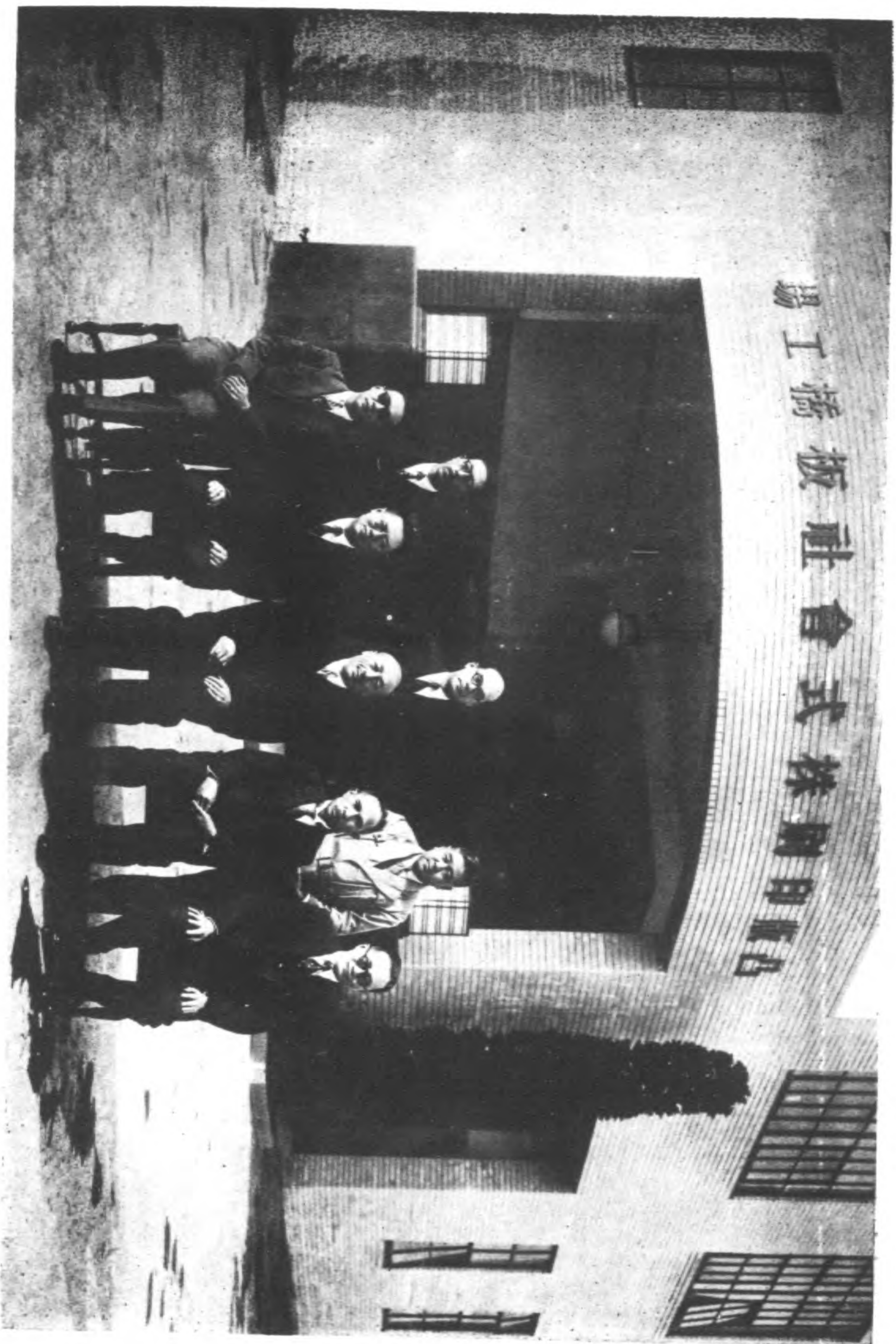
月一十年七十二 影留所刷印版凸觀參京東在時會議協化文亞東席出長局育教市京北