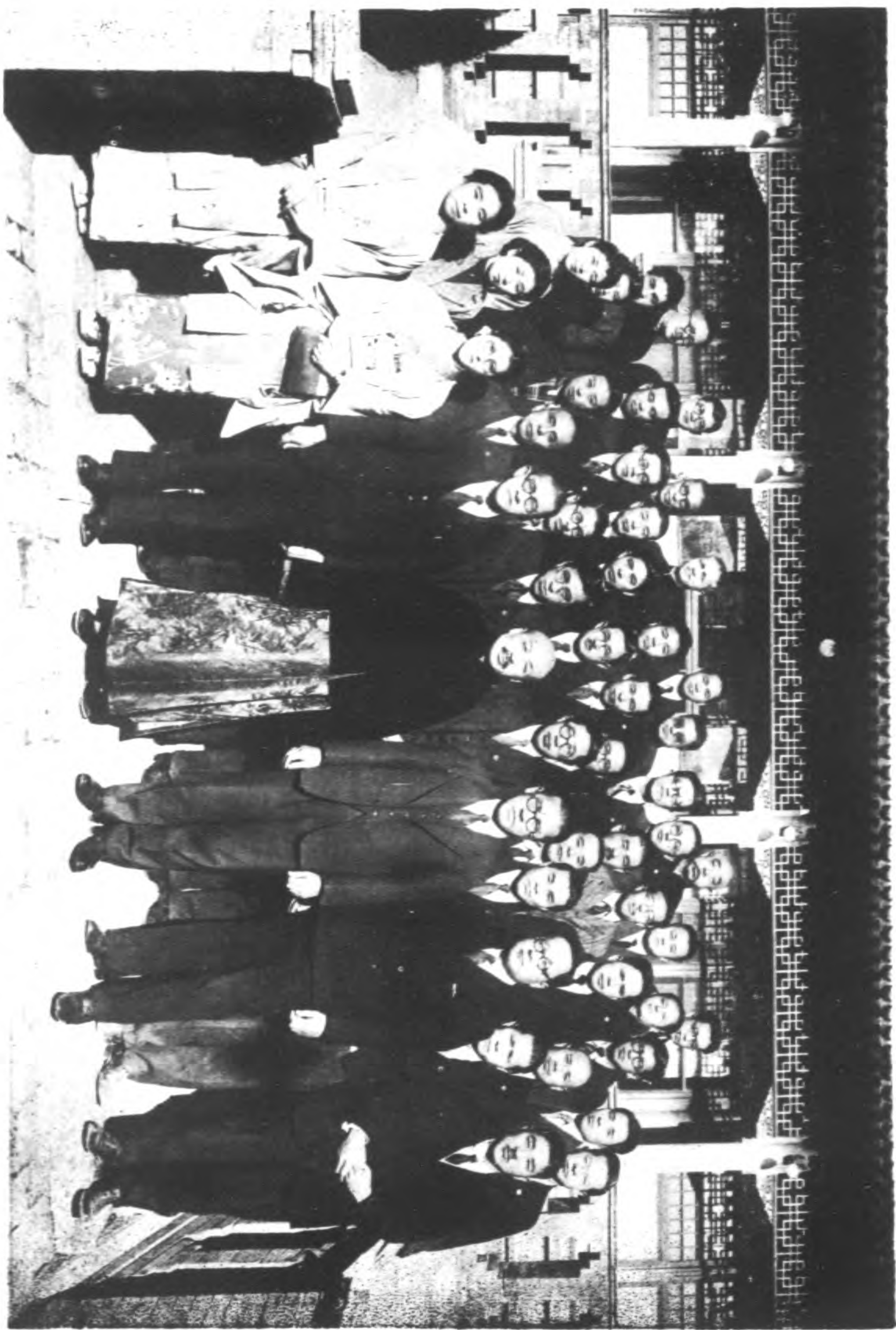
北京市教育科局長及職員合影 二十八年八月