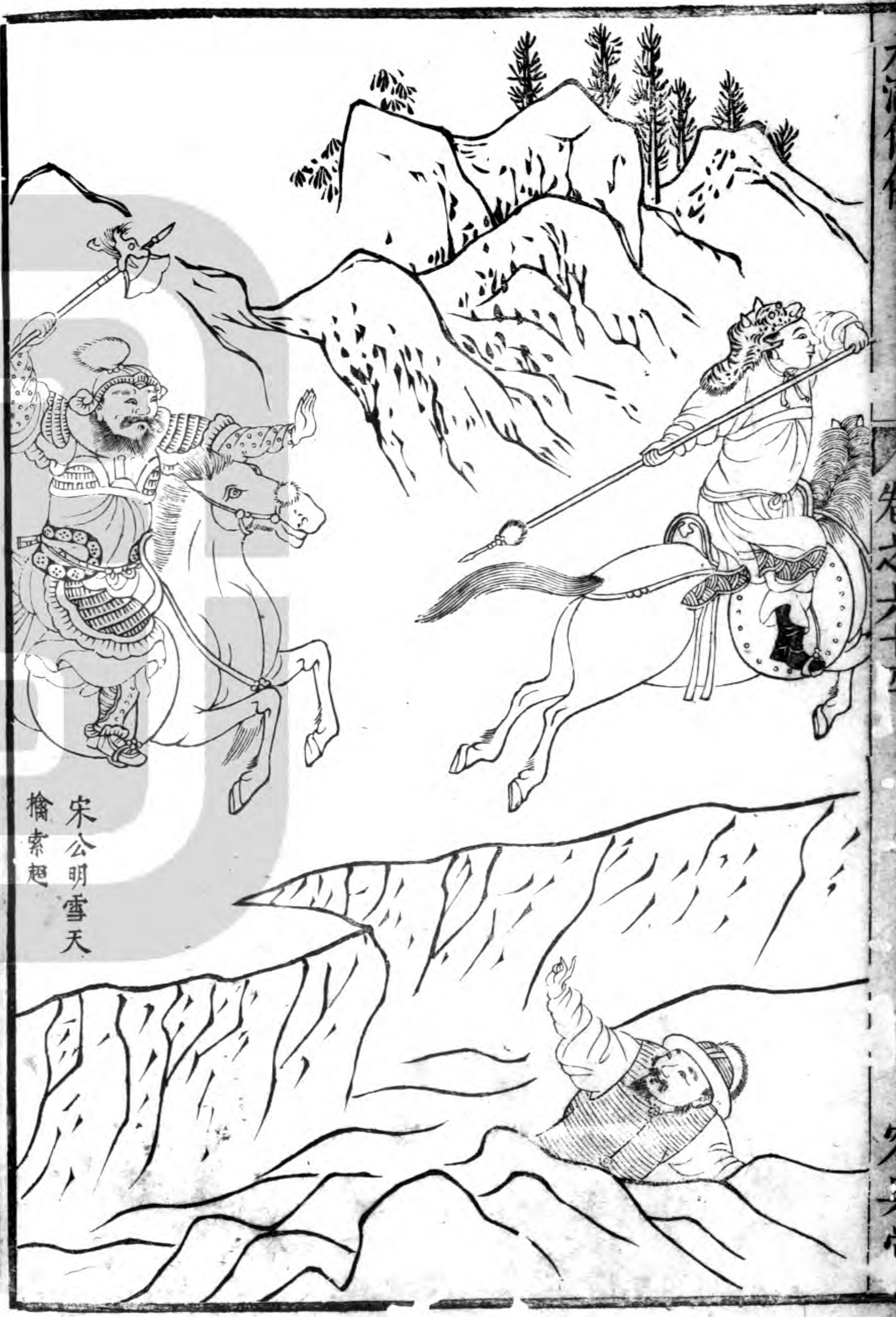
宋公明雪天擒索超