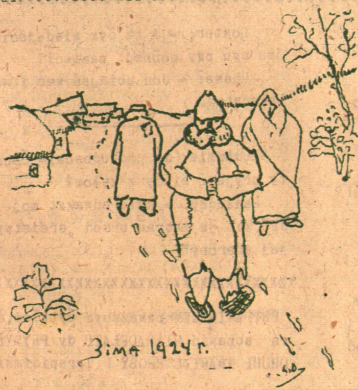
Žima 1924 r.