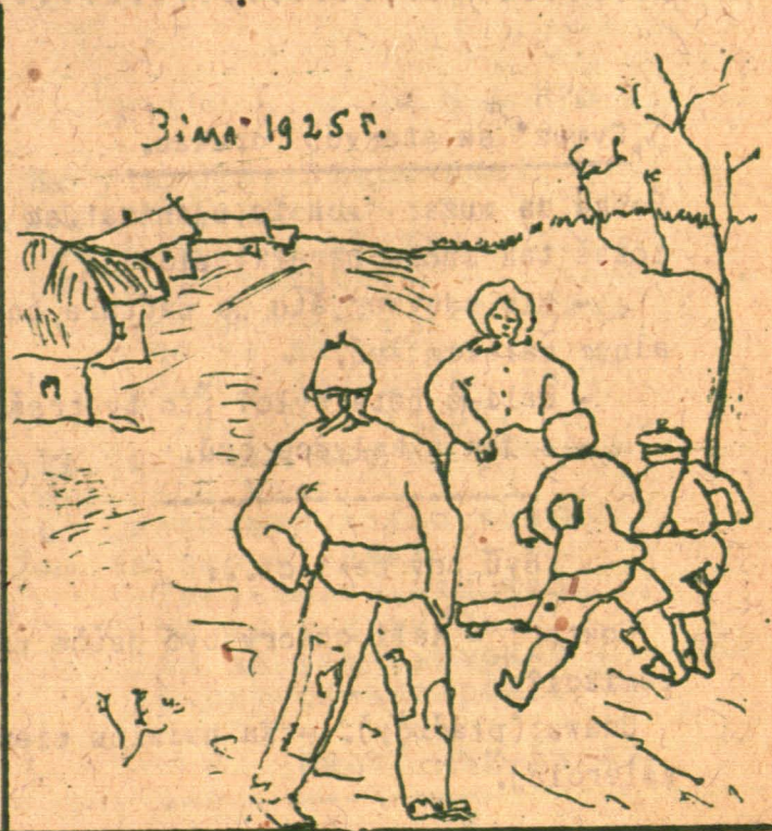
Žima 1925 r.