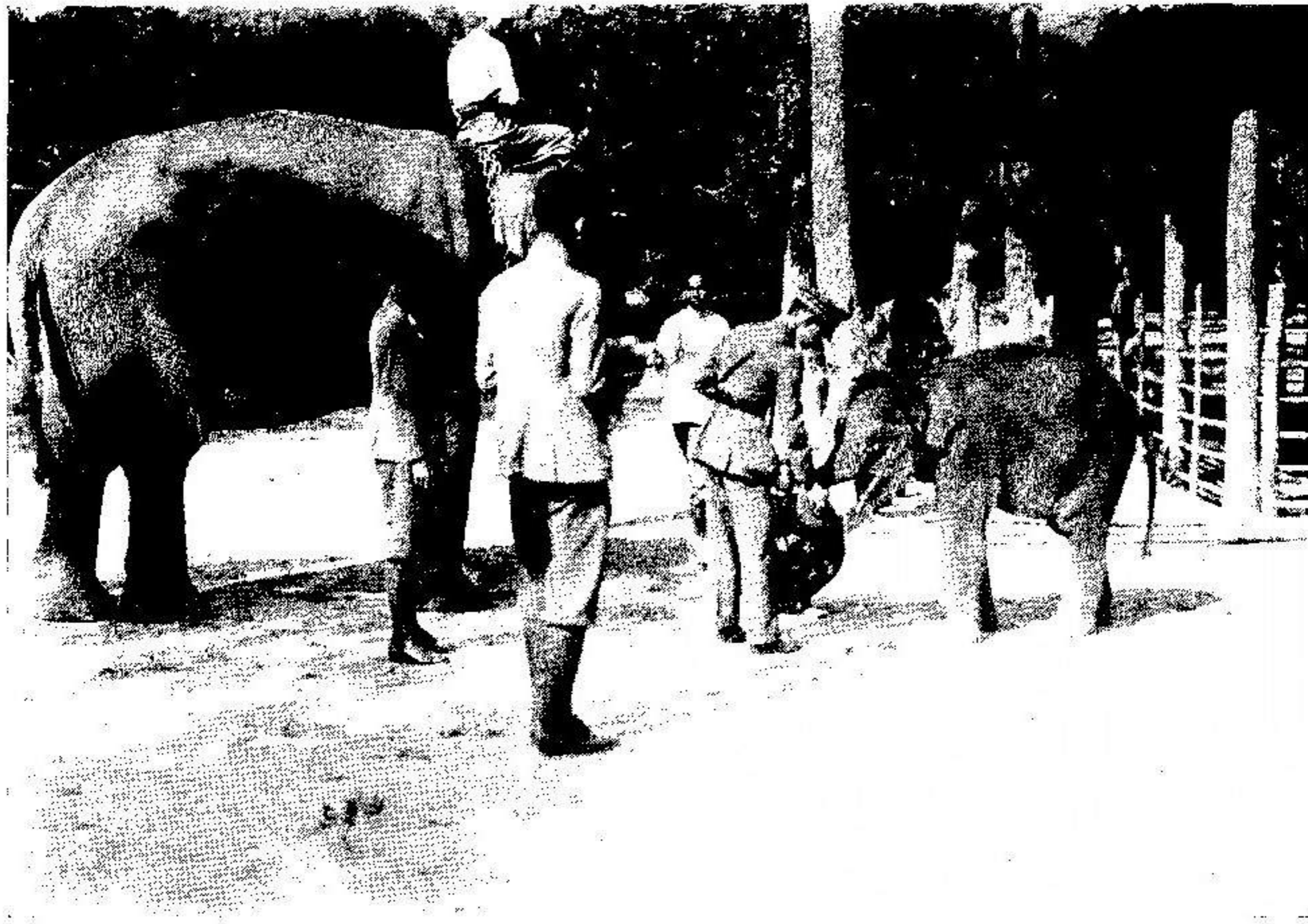
พระเสวตถุชเตชนัตถก เข้าเฝ้า ฯ พระบาทสมเด็จพระเจ้าอยู่หัว ที่เมืองเชียงใหม่ เมื่อวันที่ ๒๔ มกราคม พ.ศ. ๒๔๖๕