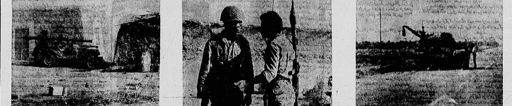
مناطق اطراف خوی‌شهر و آبادان و بیابانهای حومه سوگر گورستان نانکها و دیگر نظیرات جنگی خرابی‌ها شده است. پس از ننگ میوه شده عراقی در خوی سوگر است که رزمندگان سلبان و پاسداران همین اسلحه با آنرا از کار انداخته و سرشتانش را به خاکت رسانیده‌اند.