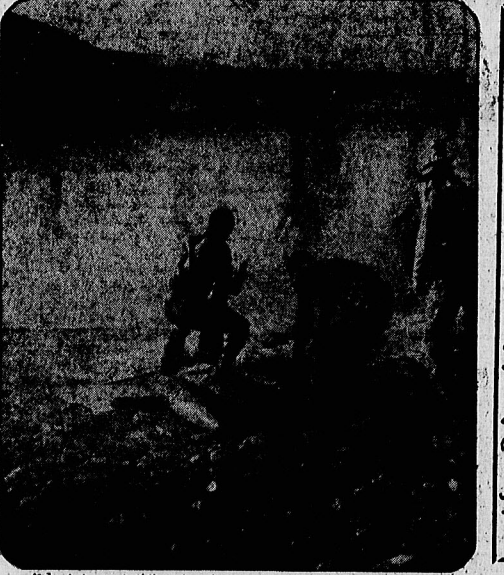
دلیبران جانان نیروی زمینی ارتش جمهوری اسلامی ایران با نیروی توان یافته از ناله با اجرای آتش نفی و شدید خود از نخستین ساعت صبح دزفول را به تصرف مجاز ارتش مزدور عراق را در جبهه های جنوب درهم کوبیدند و خسارات سنگینی به آنان وارد کردند. در این عملیات نیروی هوایی جمهوری اسلامی و هواپیمای رزمندگان زمینی را پشتیبانی میکردند.