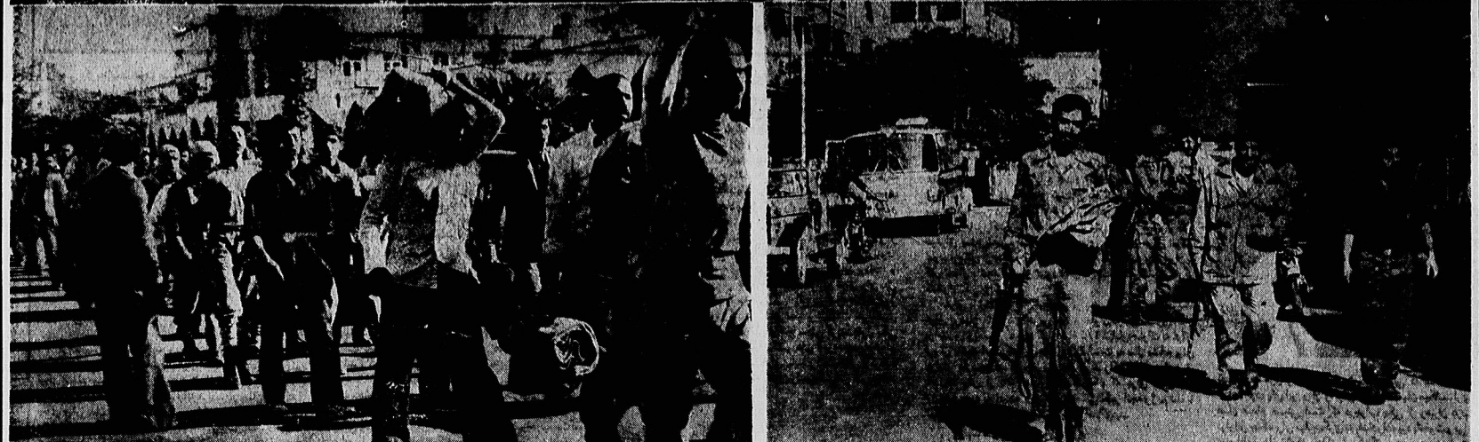
جوانان رزمده آبادان یک‌دست اسلحه و با دست دیگر دو فرس نان گرفته‌اند تا به سگر خود باز گردانند. یکی از خیابان های شهر قهرمان آبادان است که مجسمان می خورند و می‌ریزند و دیگر مهاجم. پست عراق کله می بارد. ارتش‌مهاجم به‌شرف ارتزادگی و استقامت در مانده جوانان مدافع آبادان به‌خیرتر زنده‌اند و مسامحت شده است.