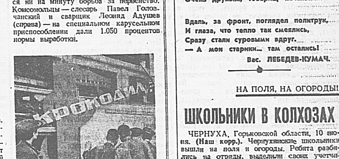
«А что сегодня пишет наш «Крокодил»? — спрашивают друг у друга молодые рабочие перед обеденным перерывом и спешат к станку, где вывешен последний номер сатирического листка. Нерядимы комсомольский «Крокодил» не дает покоя, в нем — завод молодежи, которая может и хорошо поработать и зло высмеять лентяев.

Барнаул, Горьковской области, 10 июня. (Наш корр.). Чернуха школьники вышли на поля и огороды. Ребята разбили на отряды, вывели своих участков, получили трудовые книжки. Коллектив обеспечил их инструментом и сытным питанием.