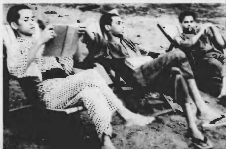
四十八づいのベッドが階上と階下に並んであるギターの入れてあるスイツケイスの横で、日本の新聞に見入る、のびた瓜を切る……