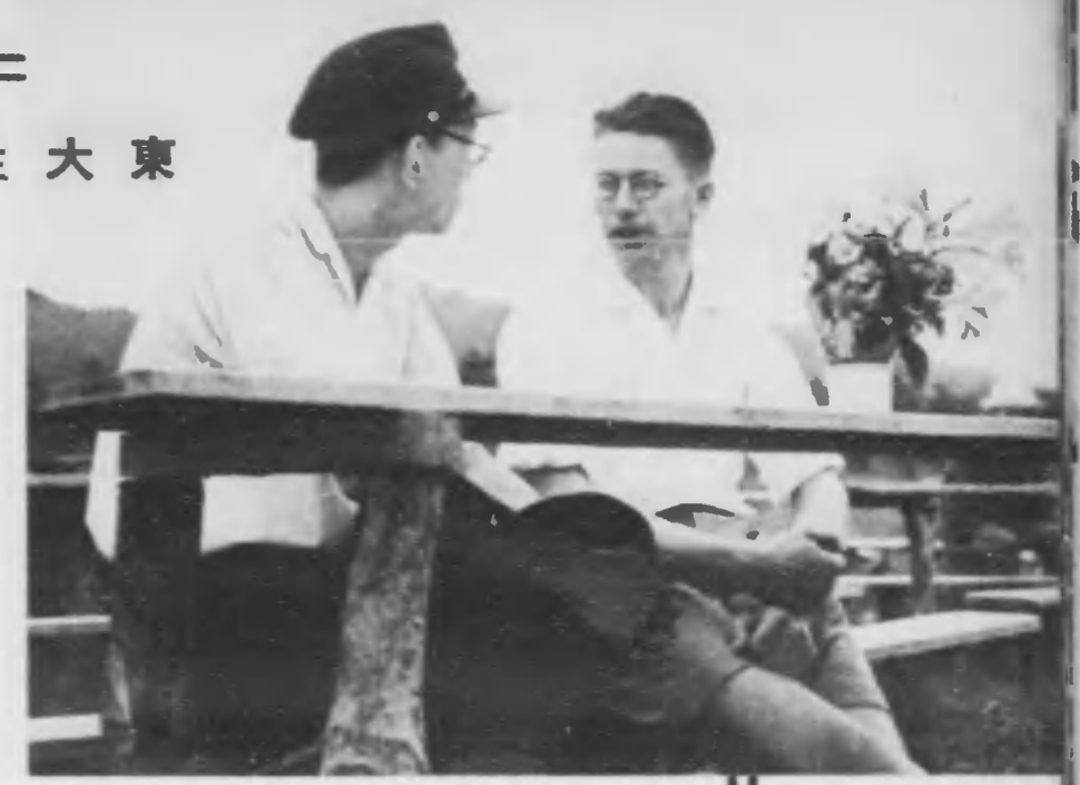
朝飯後の一時、白神の卓子によつて盛り合ふ二人。ドイツ語と日本語の隔りも一つの理解となつて静かな感傷に渾然と溶けてゆく。熊がいたか、花瓶代りの湯呑には、せんていかに、はたらくくろ、いぶきのじやこうさう等の高原の花が、優しくゆれて。

東大生の労働奉仕宿所にお客として一日を過ごしたドイツの學生が、そこで見た日本の労働奉仕と、ドイツのそれとの、構構や組織の相異を比較考察してみるのは當然のことであらう。 日本では、労働奉仕が未だ各人の自由意志にまかされて居る。また、國民の一般性態にしか見られなれない。ドイツでは、青年期から青年に労働奉仕の義務が課せられて居る。日本の労働奉仕は、義務化される以前のドイツのそれに類似した性質をもつて居る。ドイツで學生の労働奉仕宿所があつたが、それは大抵、個人的な創意に基づき、或る特殊な目的のために組織されたものであつた。即ち、その労働奉仕について不幸な人々の助けを求めたり、或は公共の利益の爲に労働に従事するといふのがその趣旨であつた。 しかし、からした初期の労働奉仕は、その根本的精神として明瞭ならざるもあつたが、民族意識の確立と共に、はじめて労働奉仕の運動に