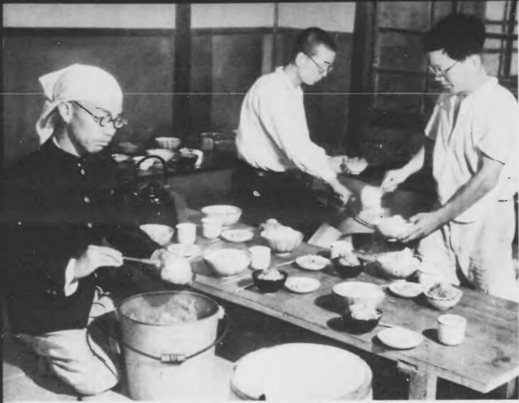
修練農場の生活は、炊事から掃除まで、すべて学生の手で営まれる。炊事當番は毎食五六十人分の食事を備ふに大奮だ。生魚など勿論食へないし、一食一菜の菜は文字通り野菜である。それに甘いものも無いので、或日の晝に食べた、香飯のお秋が、實に實に美味かつたといふ。