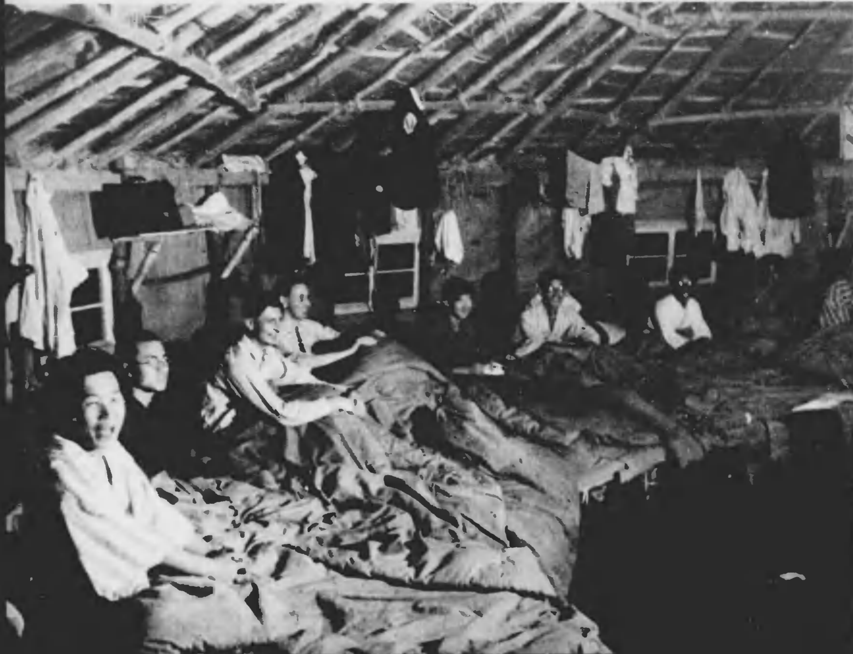
九時、消燈喇叭が鳴る。高原の空高く、秋を思はせる星は冷々とまたいき、山も眠り、谷も眠る。日輪兵舎に、枕を並べて結ぶ日獨學生の夢路は、安らかに、明日へと辿る。