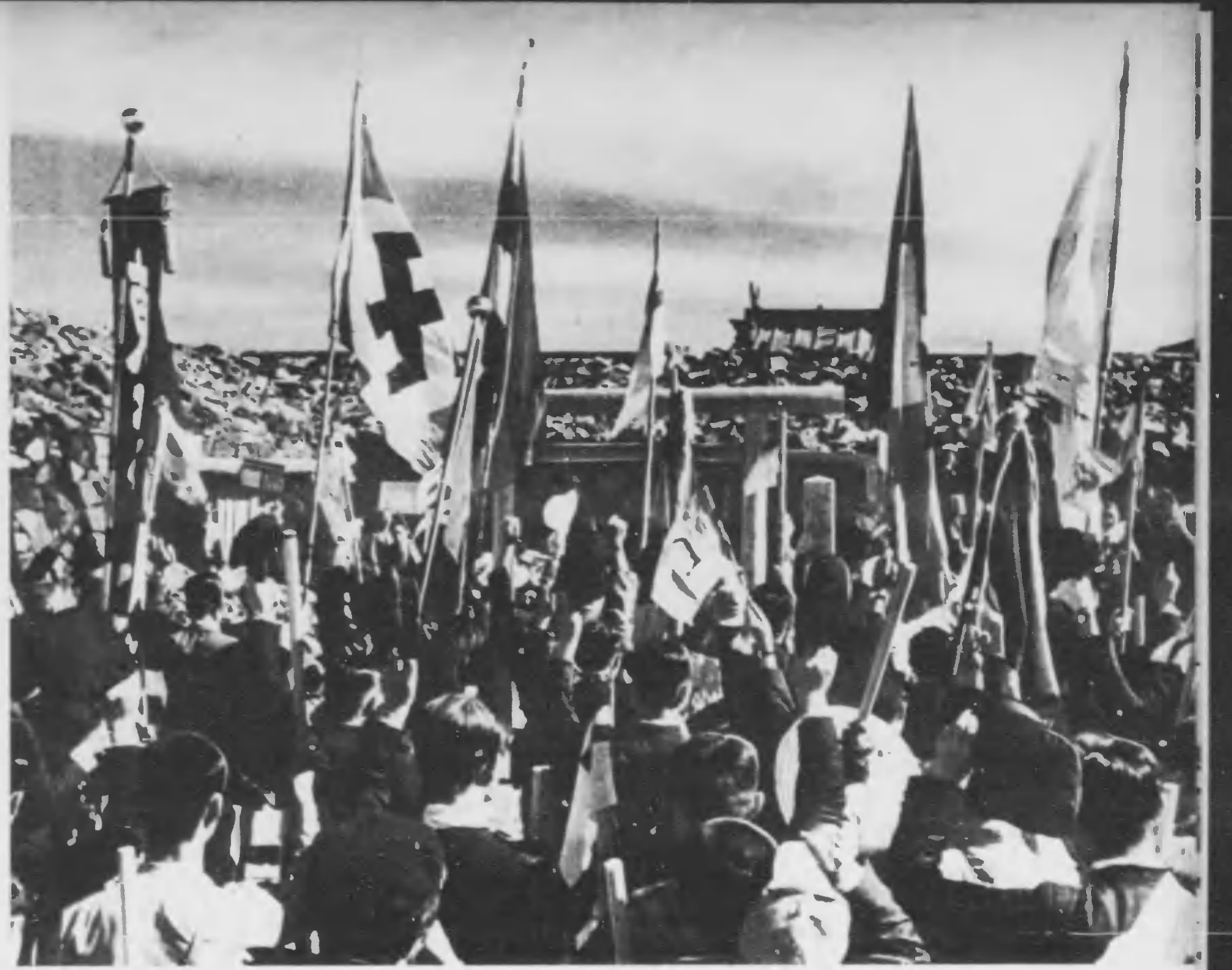
⇒ 山頂の護国神社前に勢揃ひして萬歳を三唱、防共の宣誓も高らかにしつかりと結び合ふ、七ヶ國代表。