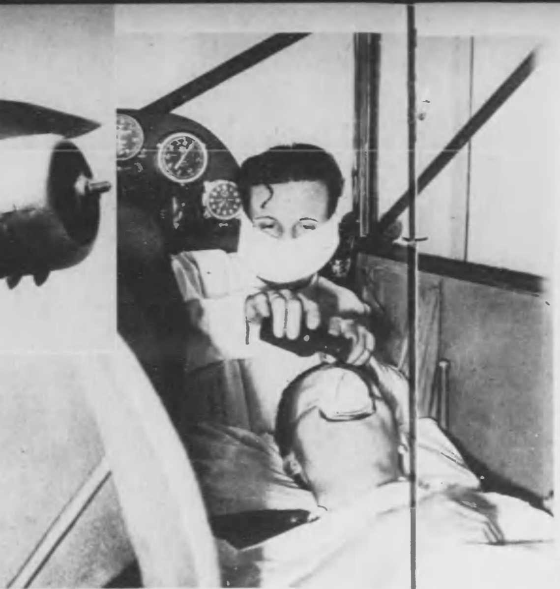
病院飛行機内 で手術 スワイスの片田舎 で重病人が出來た 病院飛行機は今ま では、患者輸送に 送られたが、この 場合はローザンヌ の病院に運ぶまで 患者を放置してお いたのでは生命が 危いと云ふ。そこで 世界ではじめて、 英海軍、成功した 術が行はれた。