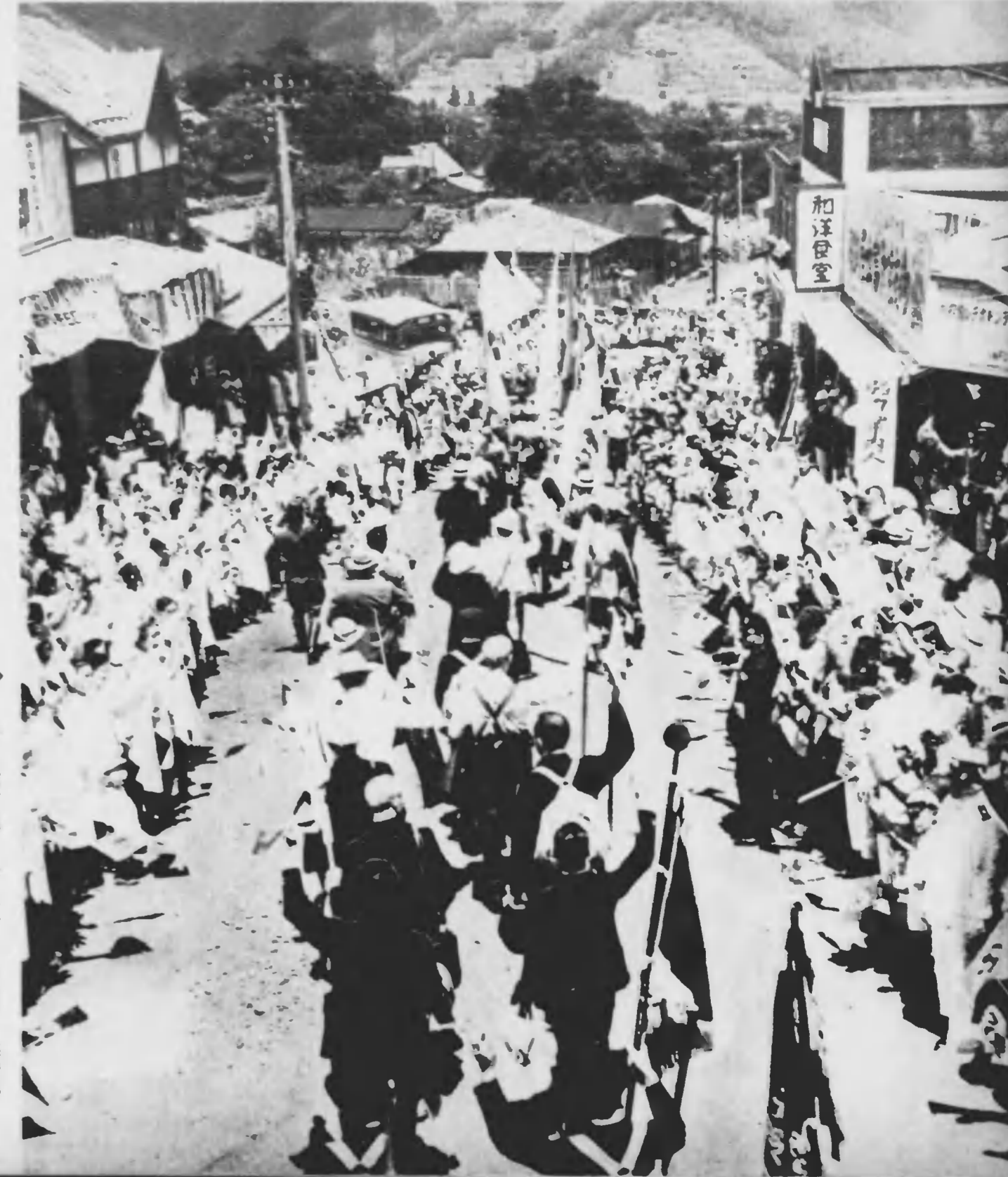
沿道の熱誠に感へながら、ブラスバンドを先頭に、防共の大旗を翻へし、吉田口の護國神社に向ふ一行

華民臨時政府代表、滿洲國留學生四十名、日本各大學代表廿二名は、午前八時三十分新沼線列車で登山隊も勇しく、壯途に就いた。 一行は、沿道各所で、小旗の波、萬葉集の歌をうけ、十一時四十分吉田驛で、ここでは地元職員、防共隊、ブラスバンドを先頭に、各團體、各大學隊を散へして、後開神社境内に向つて、國旗大行進を、山梨縣主催の防共青年會で立食の宴會をうけ、馬車か、電車と登山を開始したのは午後一時過ぎ。この日、天候は晴暑半ばだが、富士山頂には、最近にない登山日和。 八合目富士山ホテルに一夜を明かした一行は、翌朝午前四時、霞みわたる夏山の月明を利用して出発、一六級滝「一ヶ岡」の壁も勇しく、九合目あたりには、霧が、日出づる頃の御来道は夏大を、染めて、はるか雲海は金色の波と、この時、七ヶ岡は朝も千切れよ、とうと響かれ、若き防共旗隊の雄叫びは、世界の隅々にまでひびくばかり。 午前六時、一萬二千尺の頂上をきわめた一行は、皇國國旗合戦に、大日本の空高く、防共旗を掲げ、力強く防共の宣言をなし、皇軍への感謝の言葉を、大空に響かす高聲を絶叫し、各隊員へ祝電を送り、同九時、吉田驛へ下山、歴史的壯遊は、富士山に大きな足跡を残し、二子を告げた。