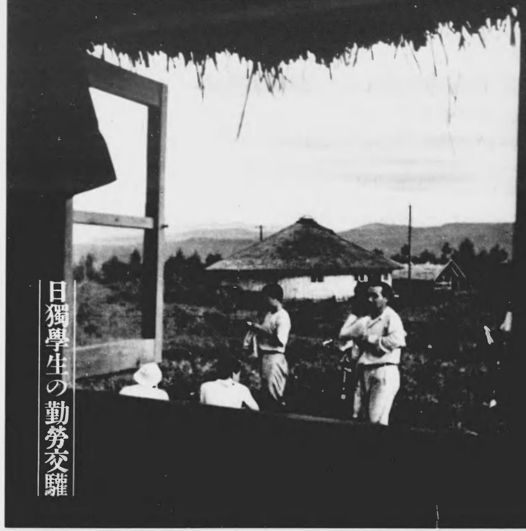
日獨學生の勤勞交驩