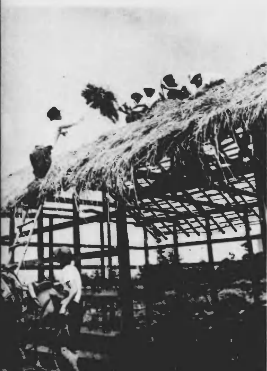
家畜小屋の屋根葺きも日課の一つだ。先づ作業の中で一番重要な仕事なので、はつと一息つける。家根の上で、八ヶ岳、アルプスの雄姿、徳高を眺めながら、藁をふいてみると、心は遠く、農業時代にかへつてゆく。