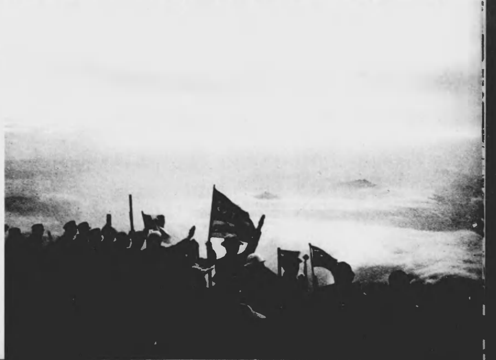
⇒ 見よ、東海の空明けて、旭日高く輝けば、天地の正氣激刺と、希望は躍る、大八洲。