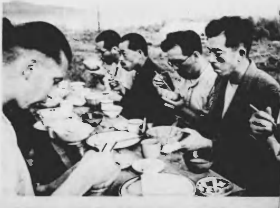
朝飯は、味噌汁と薄焼、粗末だが、朝四時半から起きて駆け廻つた生徒は、二杯、三杯とお代りを要求する。清らかな空気が匂ふばかりの野天の食卓で、ピットラー・ユードントも負けずに、茶飯をかきこむ。