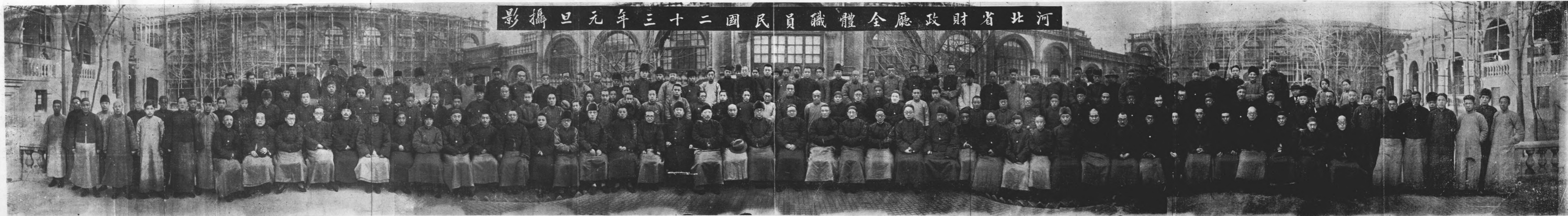
影攝旦元年三十二國民員職體全廳政財省北河