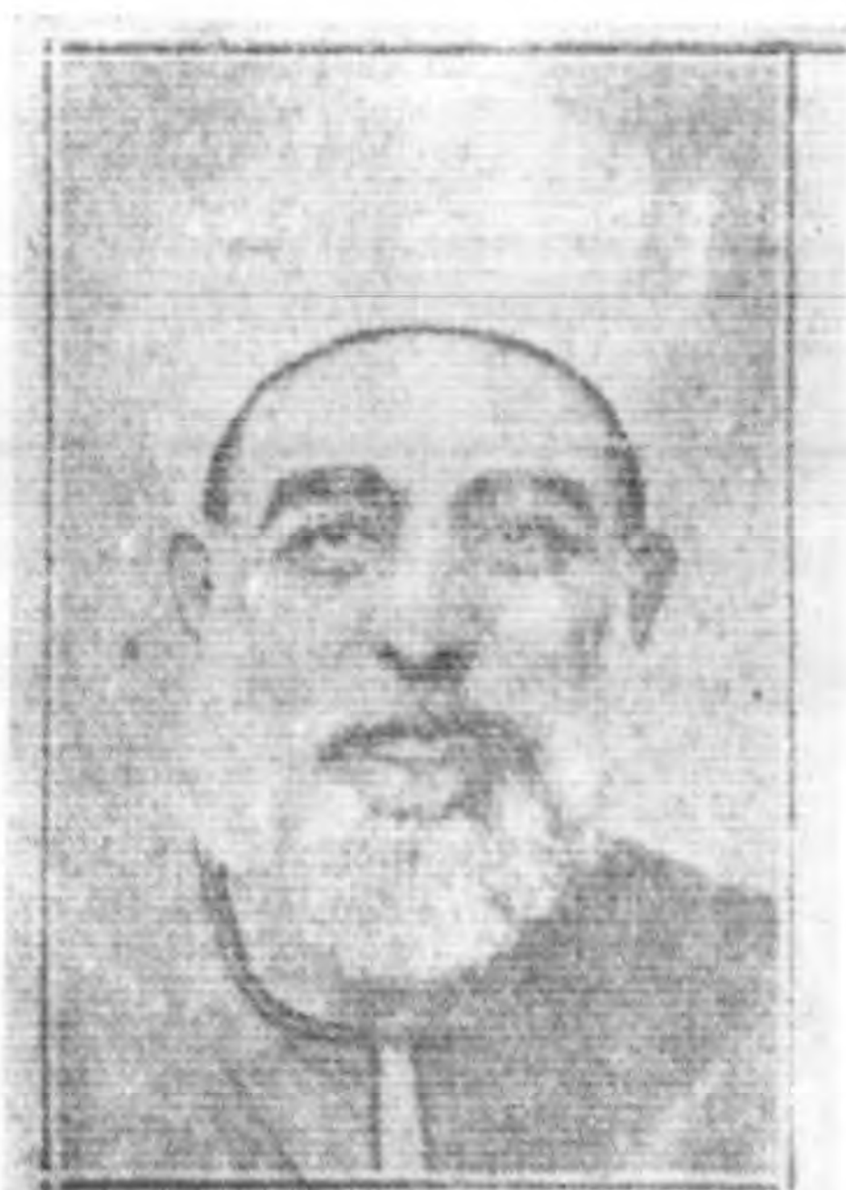
前校長 西理氏 篩海佐 瓦