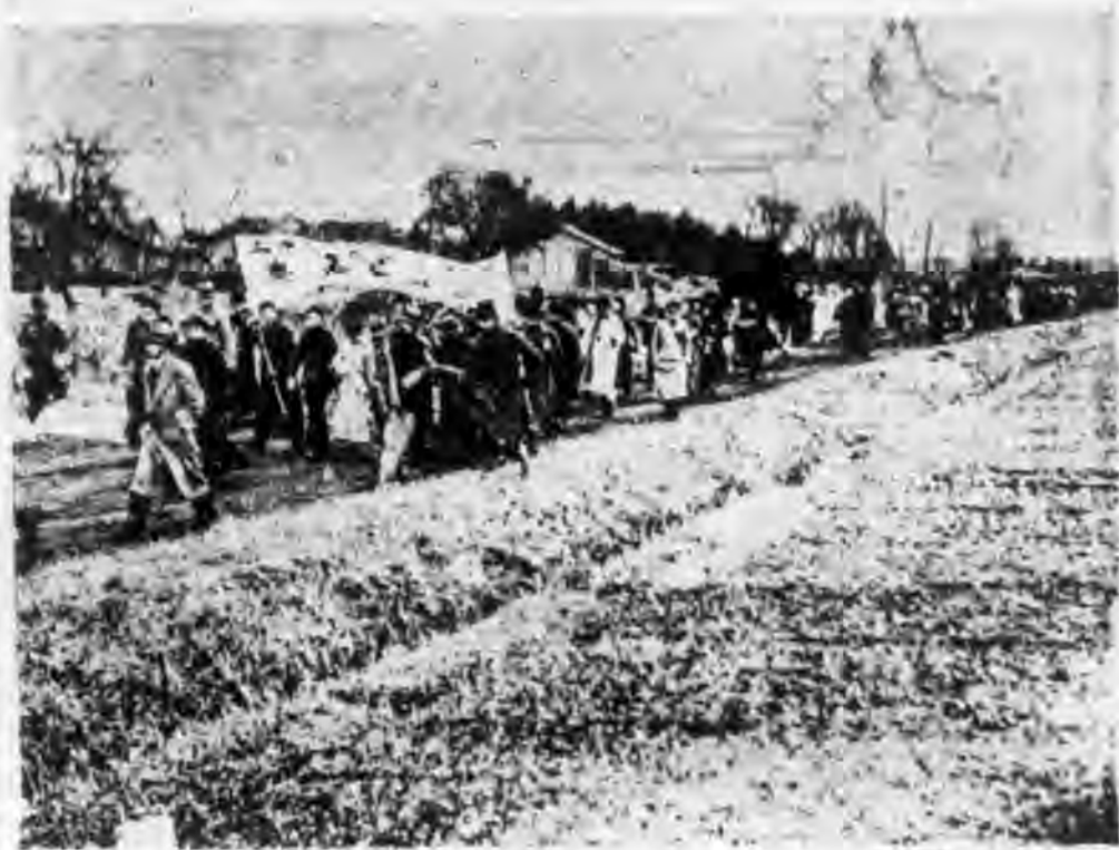
羣衆自市商會經租界開北向廟行無名英雄墓前進