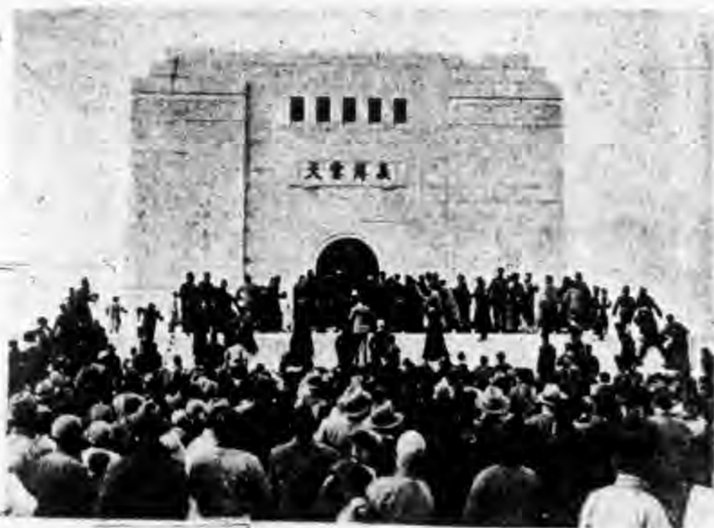
致祭既畢羣衆發現漢奸一部份人遂起而懲戒之