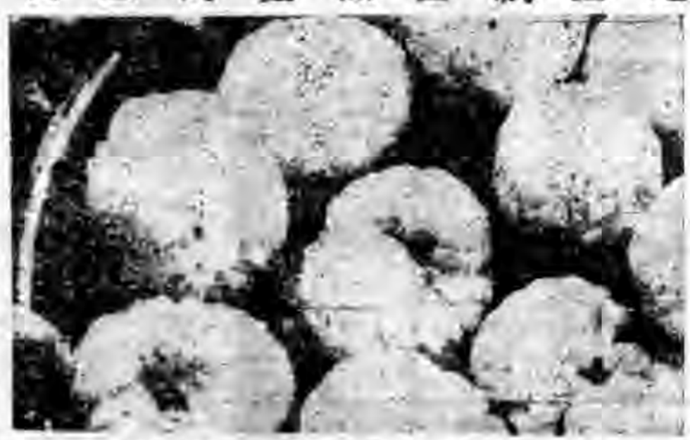
第二二圖 這一籃子雹，是在雷暴之後，拾起來的。你可以拿牠來和左上角的大擲箱比較比較牠的大小。

大概在下雹這一天，地面的空氣一定很熱，而天空的空氣却非常冷。所以，祇要稍爲激動一下，立刻地面的熱空氣，就成了一股熱風，直向天空射去，而天空的冷空氣，也像離開弓的箭，直向地面飛來。向天空射去的熱風，一直竄到極高極高的天空，有時候能達到十公里以上。水蒸氣便在那裏結成小的冰塊。這些小冰塊立刻向地面落下來，但沒有落到地面，又被向上吹去的熱風，帶得向上升。立刻，就有更多的水蒸氣，附着在小冰塊上凍起來。這些小冰塊，這樣上上下下的落來落去，結果，就變成大冰雹落下來了。