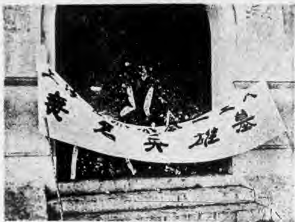
廟行無名英雄墓前