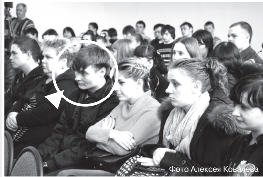
Мы любим наших читателей! И готовы дарить им подарки!

Предлагаем читателям принять участие в конкурсе! В каждом номере будет напечатана фотография: ваша задача - узнать себя! Или своего родственника, знакомого, коллегу... И сообщить ему. Ведь того, кто отмечен на фото, ждет полезный сувенир от «Переславской недели»! Вглядывайтесь, узнавайте... И получайте приз!