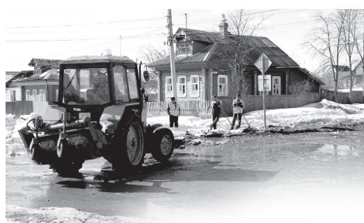
08.04.13 Дорожники спускают воду на углу улиц Строителей и Кооперативной