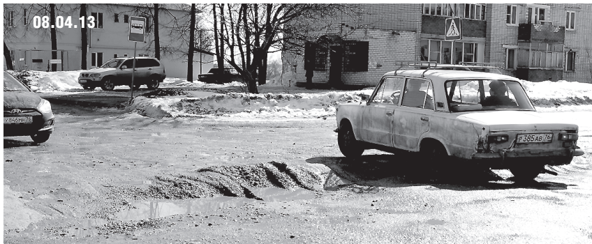
На месте ноябрьских работ по ремонту теплотрассы на пересечении улиц Кооперативной и Октябрьской сегодня глубокие ямы, заполненные раскисшей глиной