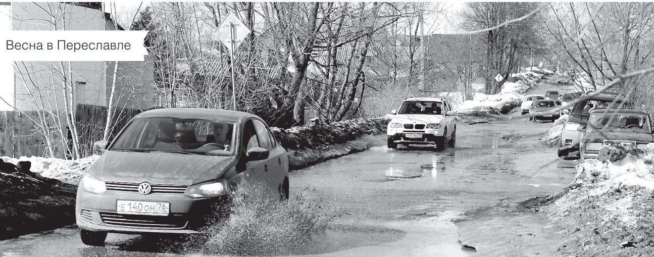
Весна в Переславле