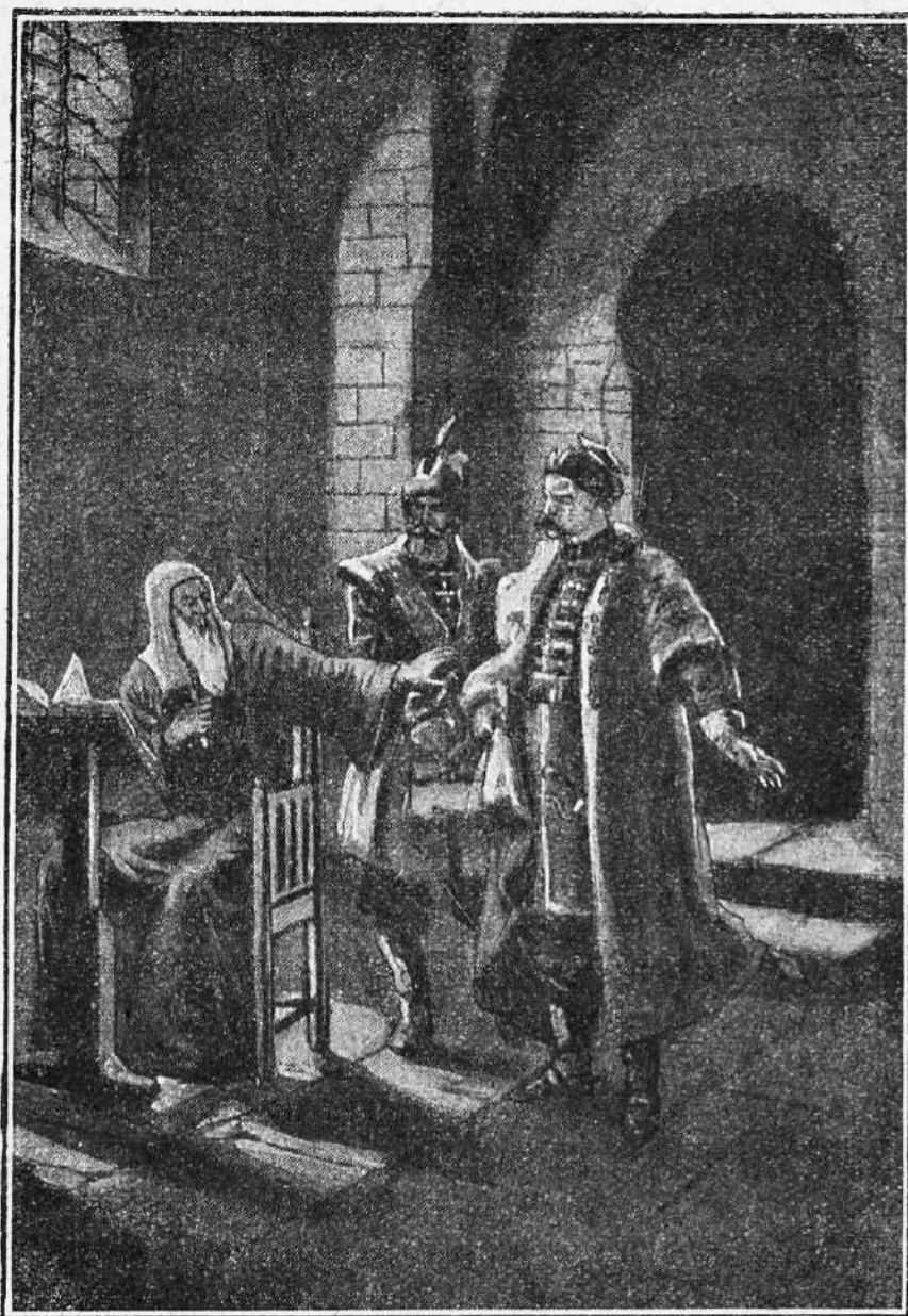
Патріархъ Гермогенъ въ темницѣ Чудова монастыря.