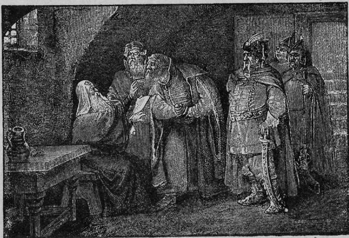
Патріархъ Гермогенъ отвергаетъ требованія русскихъ измѣнниковъ.

Масса ополченцевъ, шедшихъ «умереть за святая Божіи церкви и за вѣру христіанскую», устрасила лиходѣевъ. Польскій главарь Гонсѣвскій явился къ Гермогену и грубо сказалъ: