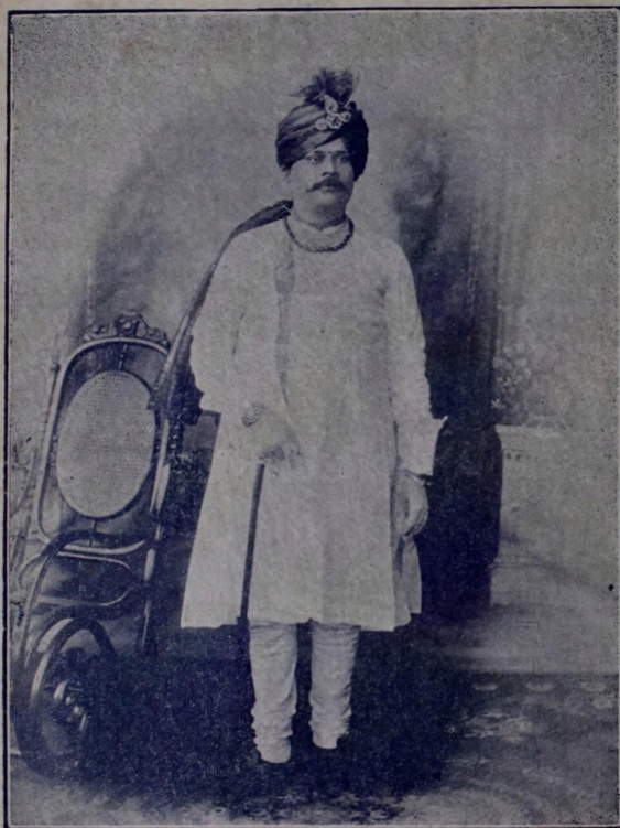
धैर्योदार्य चूडामणी, श्रीमंत सरदार गंगाधरराव रघुनाथराव गंभीरराव देशमुख, देशपांडे, सरकानगो, सावदें; जिल्हा पूर्वखानदेश.