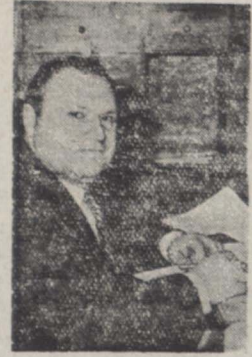
آقای استنده یار بزرگ نمبر

که گذشت زمان بما آموخته است بقیه از صفت اول