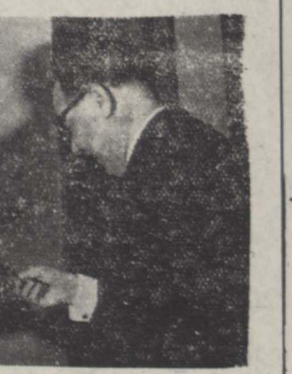
آقای استیونس سفیر کبیر انگلیس رونوشت استوار نامه خویش را به آقای انتظام وزیر امور خارجه تسلیم نمود.