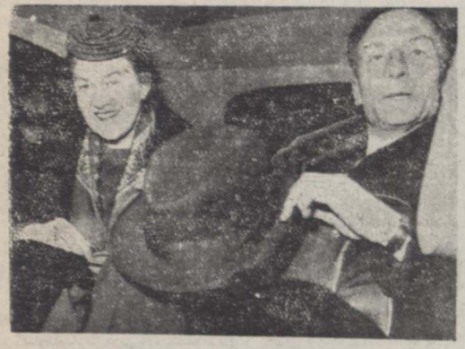
سردار جرج استیونس سفیر کبیر انگلیس با آقای امیر اسفندیار وزیر امور خارجه ایران ملاقات نمود.

وی رونوشت استوار نامه خود را تسلیم ایشان نمود وی بخبرنگاران گفت: سعی عمده من این خواهد بود که روابط دو کشور بر پایه های محکم استوار گردد و مسئله نفت بزودی بنفع طرفین حل شود.