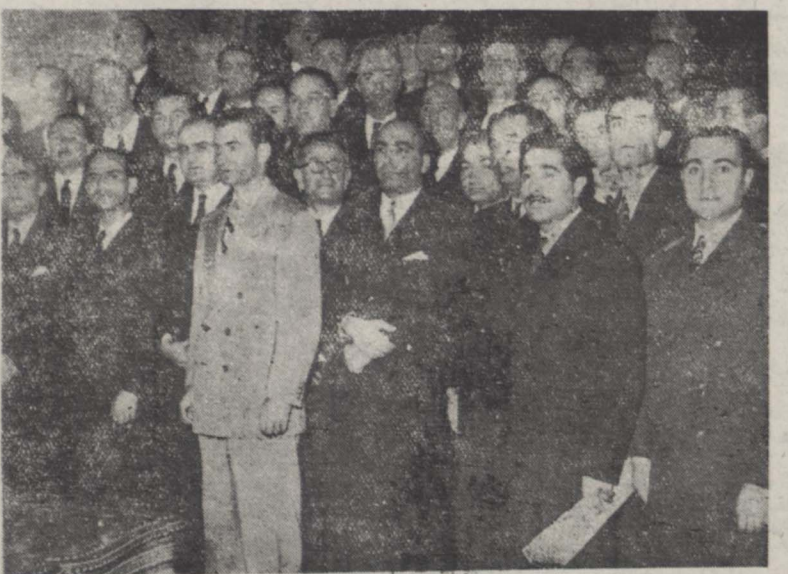
شاهنشاه در میان اعضای هیئت رسمی قانون مشاورین فنی در شرفیابی روز پنجشنبه دیده میشوند.

ساعت شش بعد از ظهر روز پنجشنبه ۷۳ نفر اعضای هیئت مؤسس قانون مشاورین فنی نخست وزیر در کاخ خنصری بحضور ملوکانه شرفیاب شدند. هیئت مشاورین فنی مرکب از اعضای مهندس، دکتر و لیسانسیه حقوقی باشد که از چند ماه قبل تشکیل شده و همه هفته روزهای یکشنبه جلسات خود را با حضور آقای نخست وزیر تشکیل میدهند. در شرفیابی روز پنجشنبه بنا بر امر شاهنشاه صورت گرفت و پس از شرفیابی آقای مهندس اردشیر زاهدی آجودان کشوری شاهنشاه، مسئولین کمیسیونهای هفت گانه قانون را به پیشگاه ملوکانه معرفی نمود و او علیحضرت همایونی یکایک بقیه در صفحه ششم