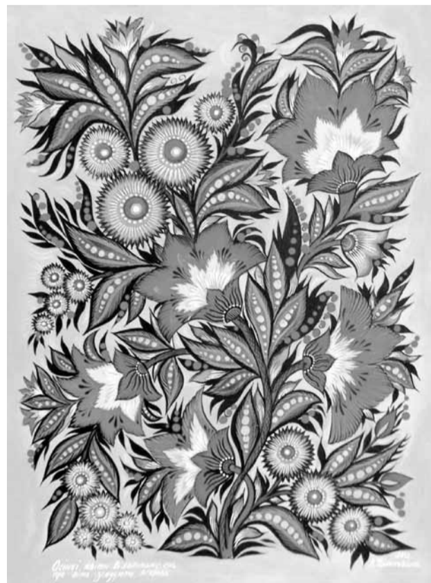
Осінні квіти в золотому сні про літо згадують яскраве.

- Кожен прожитий рік багатий подіями. Не став винятком 2012. Цього року Господь дарував другого онука - це найголовніша подія. У творчості рік виявився добрим: персональні виставки на