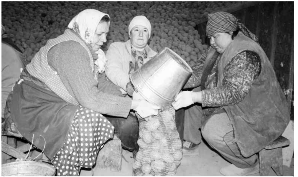
Працівниці готують картоплю для реалізації.