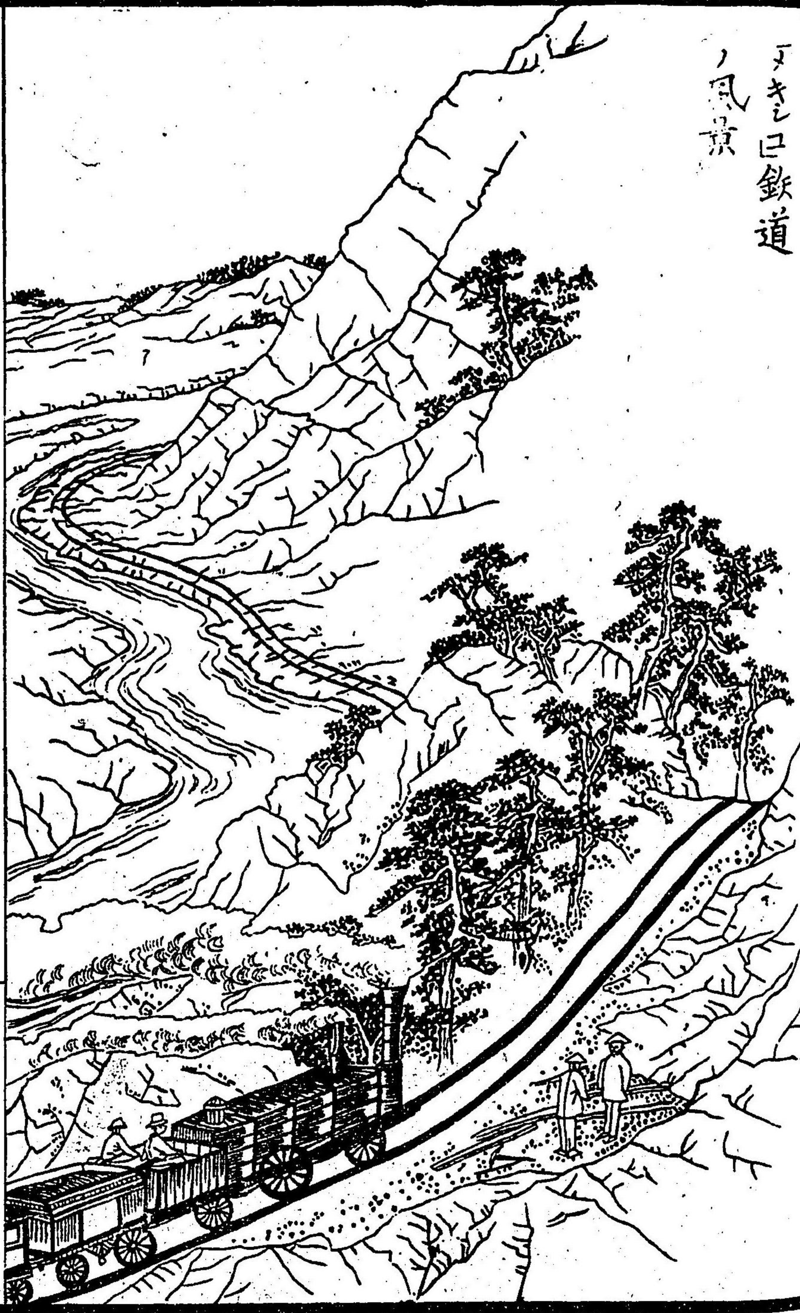
ノ風景 トキニ口鉄道

曇 り 西 き 海 かい 灣 わん を向 む て斜 かた 有 り 蓋 あし 一 いっ 本 ぽん 西 せい 海 かい 灣 わん 地 ち 之 の 平 へい 面 めん 小 せう 地 ち 多 た く海 かい 濱 べん の 候 こう を遠 とん 熱 ねつ 最 さい 七 しち 強 きやう く