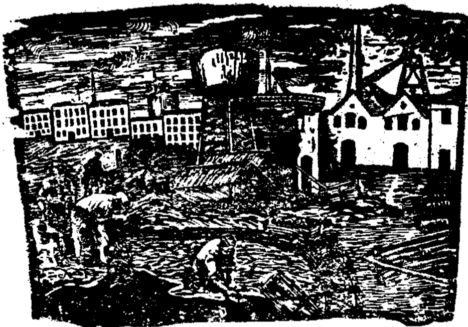
作國振孫 本資族民

納粹式的敬禮，希姆拉國內軍總司令於八月二日以軍命令第一號強力宣旨國民軍的結成。先在國防軍內設置納粹指導本部，並且把負責國防軍將兵之政治再教育任務的納粹政治指導將校分派於聯隊以上的各部隊，着手於親衛隊與國防軍的一體化。進一步德國之內政構成，由於戈培爾宣傳部長就任他力動員統監更形強化，於是希姆拉戈培爾為中心的德國保衛國內戰線的決戰態勢，由於具有統一的形勢更見確立了。