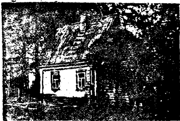
雲南同德縣湖園 (畫) 伊凡·潘夫洛夫作

那些未能完成的詩人們，却意外的接到了完成的續稿，是一個單弱的姑娘，她說經過了一個狂風與冷酷的冬季，回味着於舊園林裡過去的麗春與濃陰的長夏始完成了這些作品。 但是聽說這單弱的波克姑孀娘的生命却在續稿完成的當夜也永遠的離開人間了。