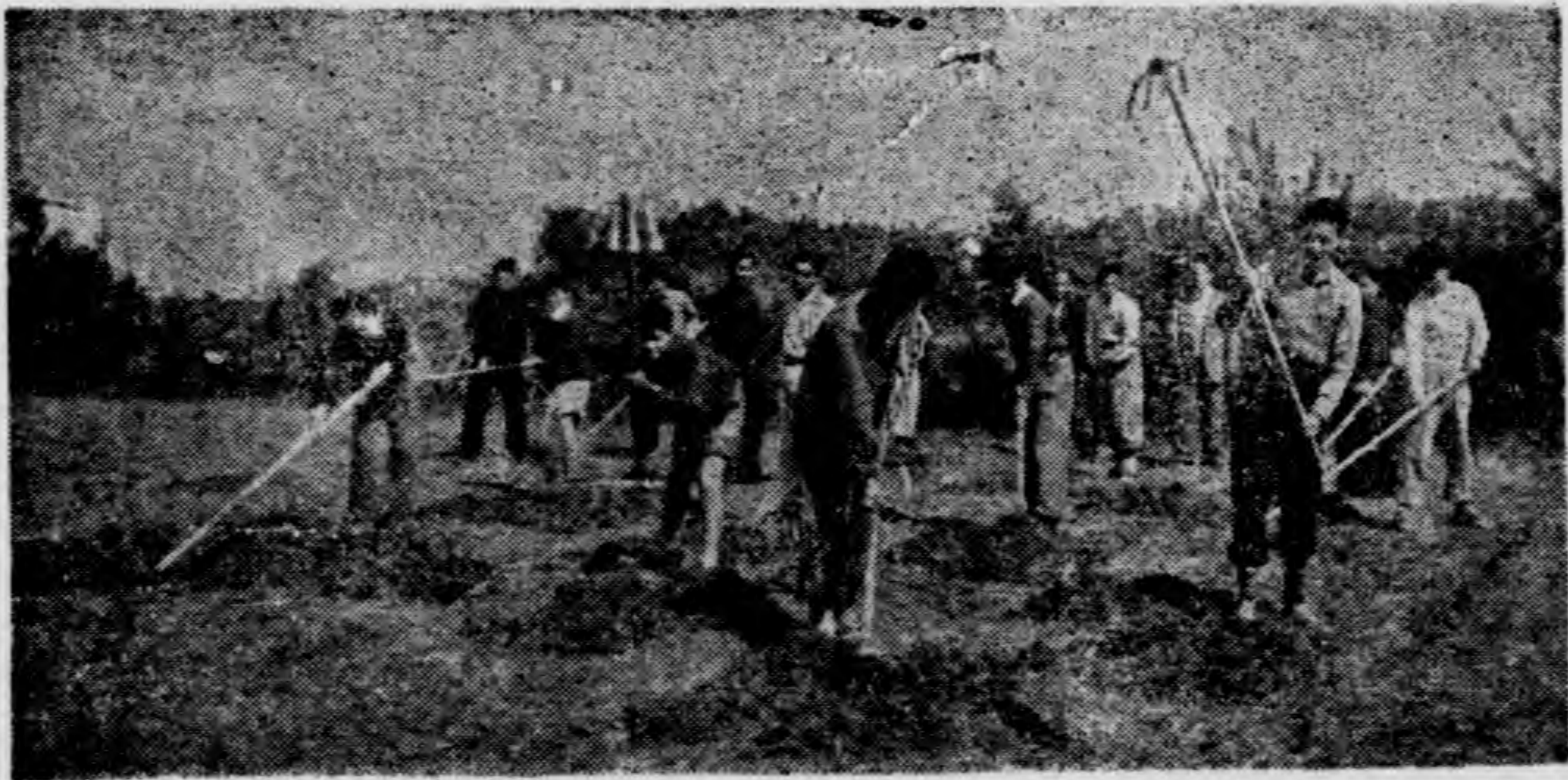
◀ 整地工作 ▶