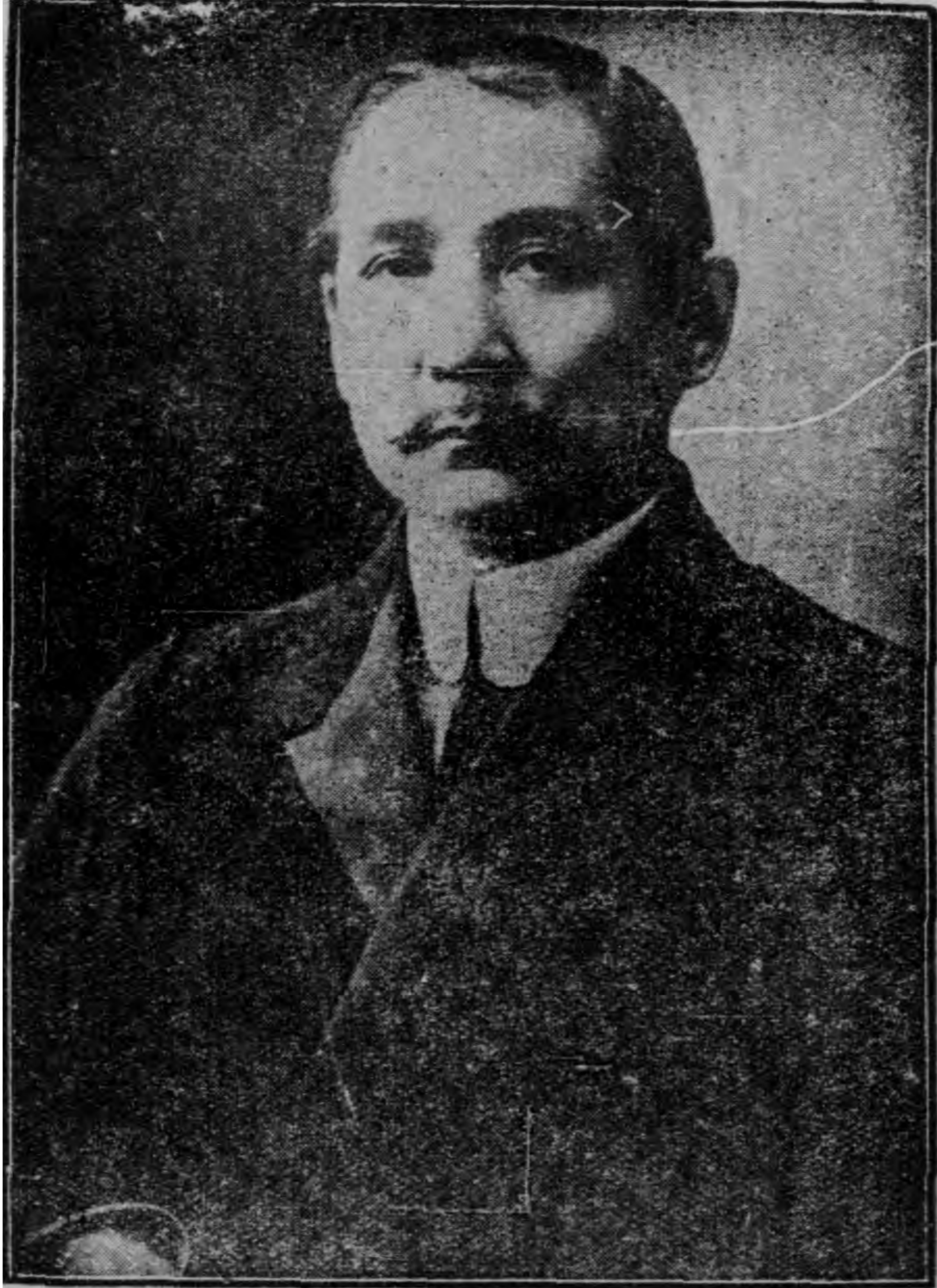
總 理 遺 像