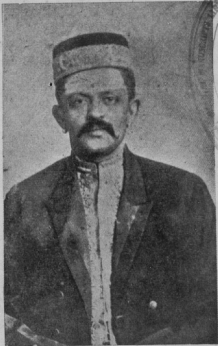
ஸ்ரீ பாண்டித்துரைத் தேவர்