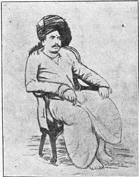
ஸ்ரீ பொன்னுச்சாமித் தேவர்