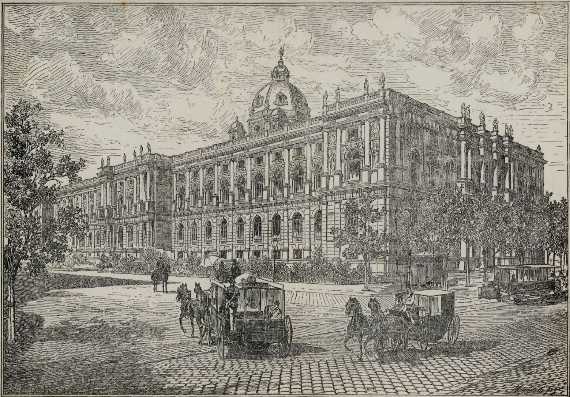
MUSEULU DIN VIEN'A.