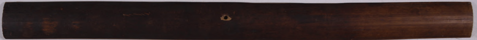
USADA PETENG CARMA LAMBANG JENER 01 Druwen Griya Toko, Lod Pasar, Denpasar