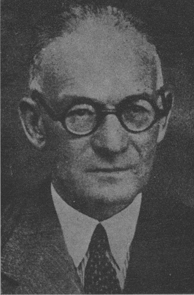
Mazhar Müfit Kansu 1874 — 1948