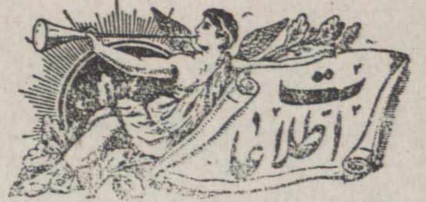
روزنامه یومیة عصر