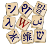
Wiktionary The free dictionary