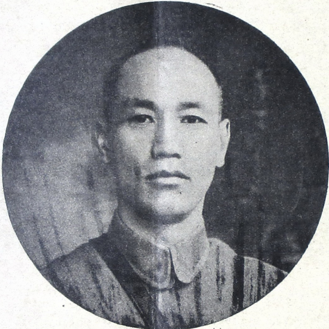
Tsjang Kai Shek.

ပြည်ထောင်စုတစ်ခုကို ဖွဲ့စည်းရာတွင် နိုင်ငံရေးအရ အရေးကြီးသော အချက်အလက်များမှာ အောက်ဖော်ပြပါအတိုင်း ဖြစ်ပေါ်လာခဲ့သည်။