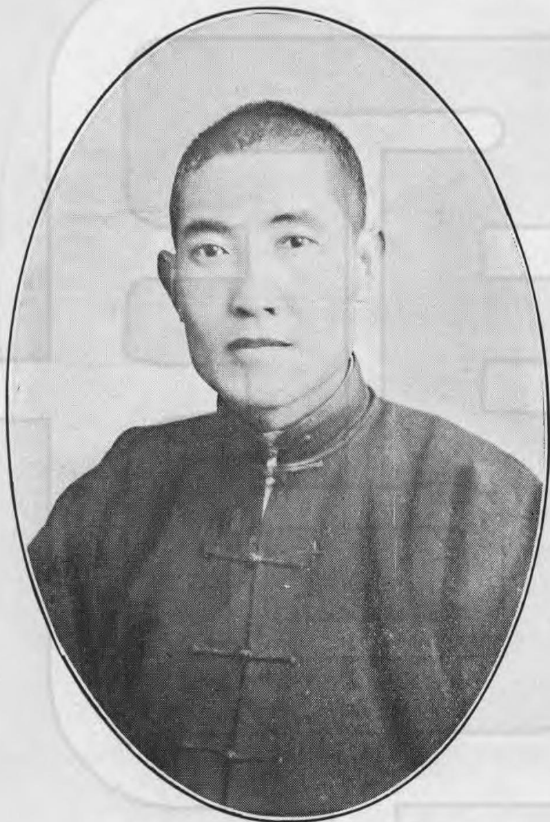
璞玉傅長局育教安台