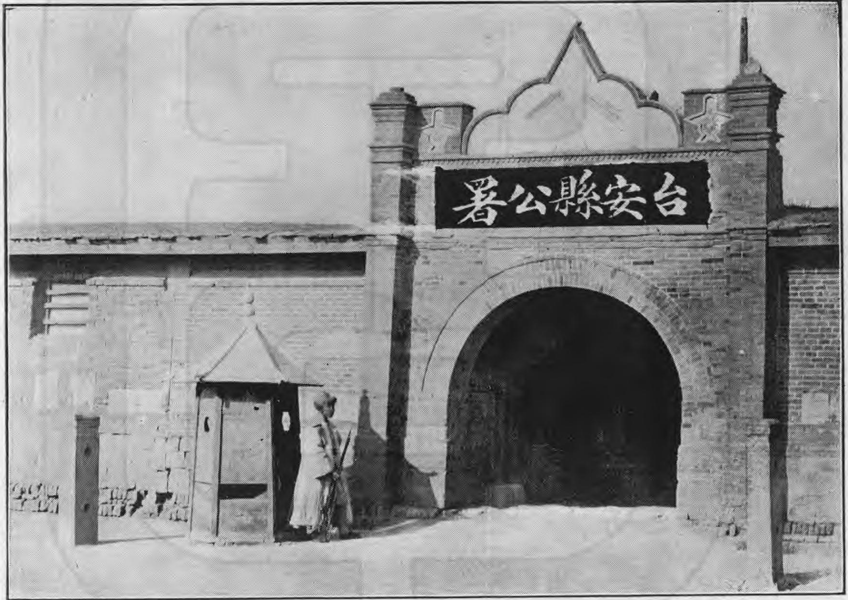
縣 公 署 正 門