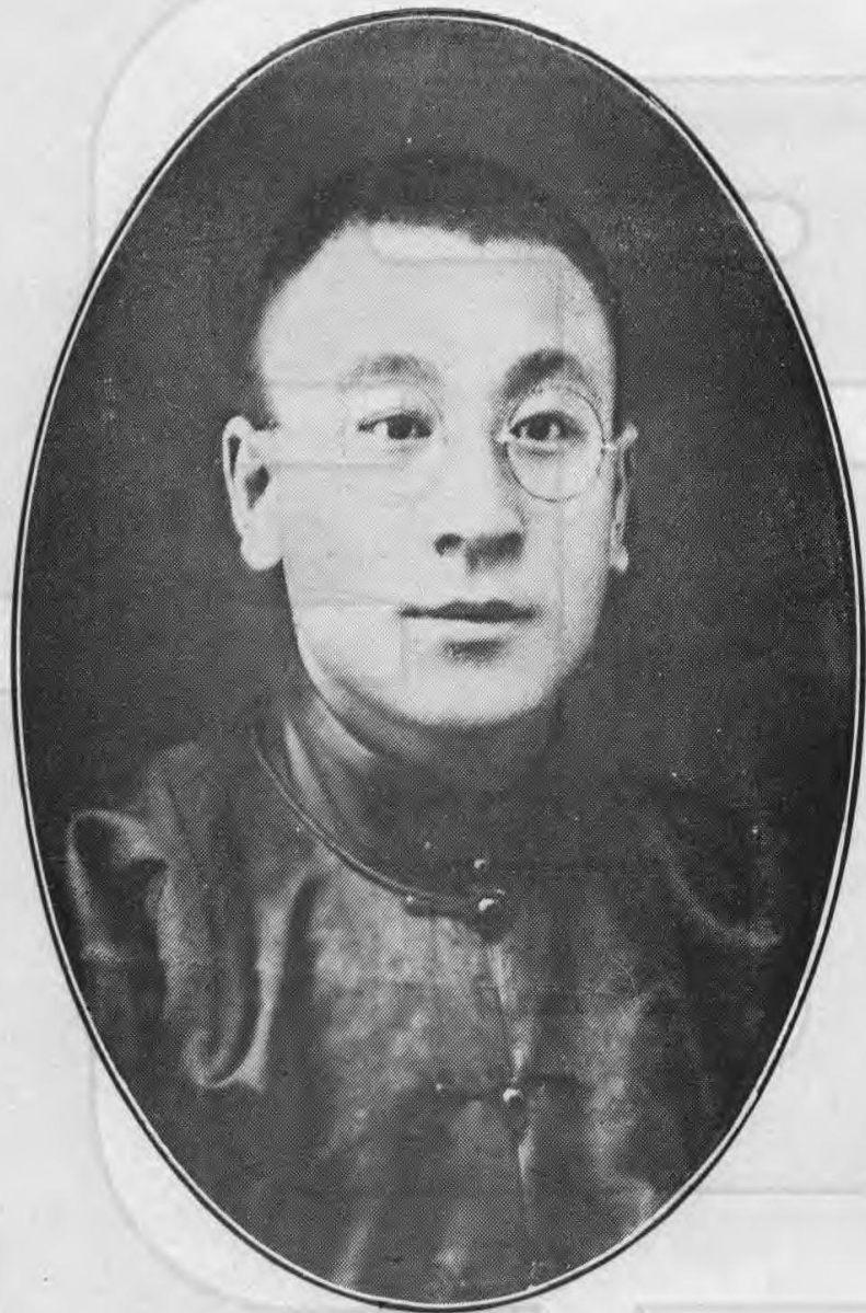
善維孫事知縣安台