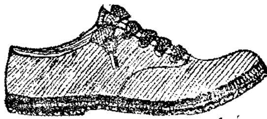
新到 大批 黑 橡皮 底鞋