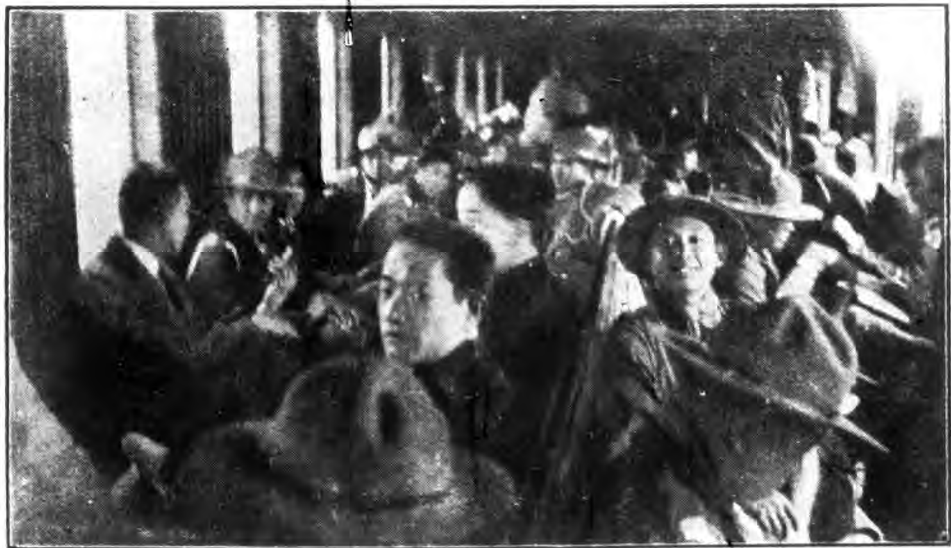
本校本童子軍團旅杭返滬車上攝影