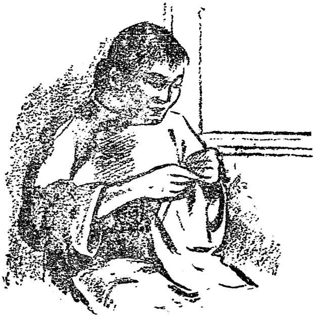
衣 卷 做 (6)

往年山歌唱幾回。 六月裏來熱難當， 蚊子飛來叮胸膛； 寧可吃奴千口血， 莫睜將士萬喜良。 七月裏來正秋涼， 家家窗前裁衣裳； 青紅藍綠都裁到， 做好新衣送前方。 八月裏來雁門開， 孤雁足下帶書來； 征人只說征人話，