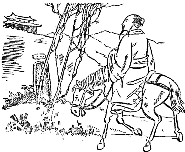
嘉峪關上林則徐騎馬 (3)

翰海蒼茫入望迷， 誰道穀谷千古險， 回看祇見一丸泥。 林先生騎了一匹肥 壯的馬，跑了千萬里的 長路，經過嘉峪關，應 該歇一歇腳了，他往前 看看，又往後看看，不 但不灰心，反而勇氣增 加百倍。跨上了馬，揚 起鞭子，向塞外沙漠地 帶跑去了。這首古詩，